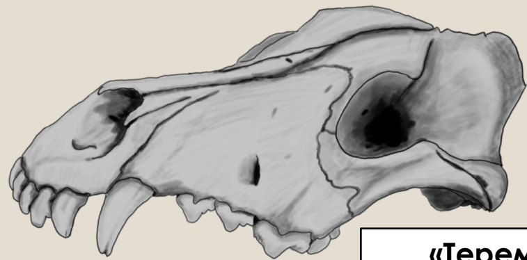
«Теремок» Художник: Георгий Нарбут