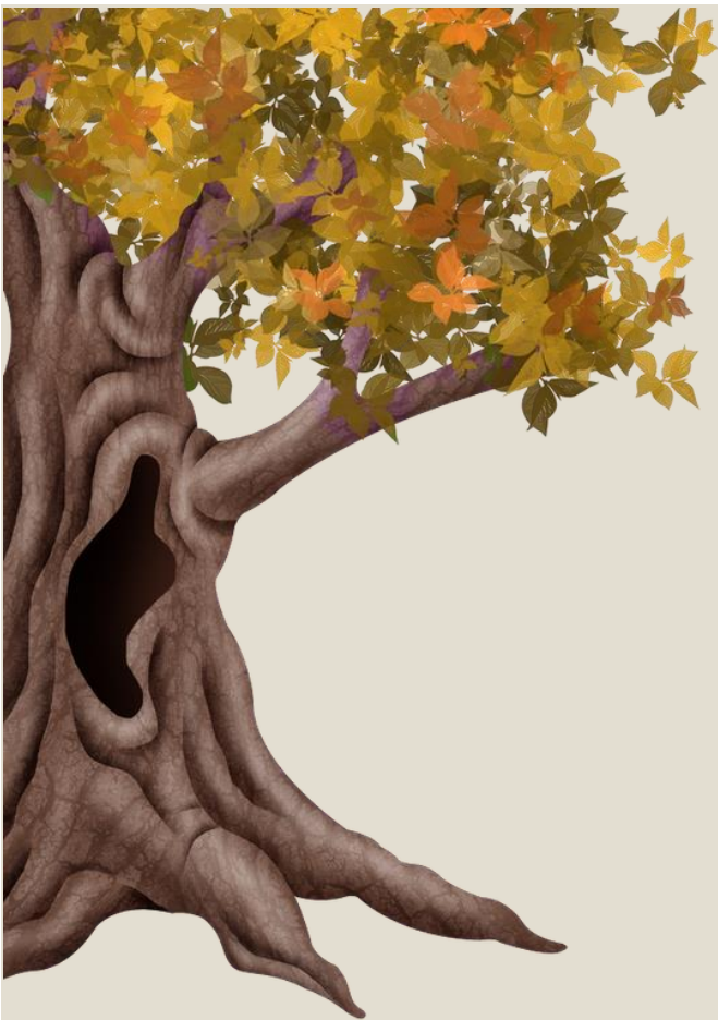
«Теремок» Виталий Бианки