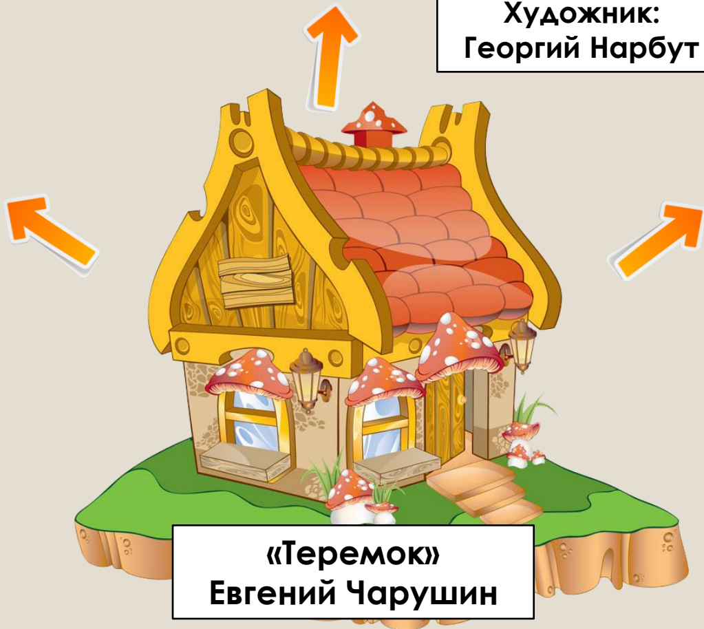
«Теремок» Евгений Чарушин