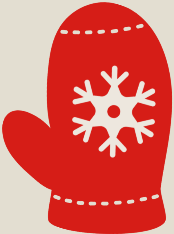
«Теремок» Русская-народная сказка