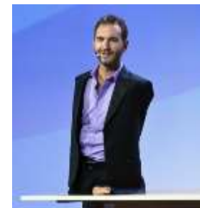
Ник Вуйчич – австралийский мотивационный спикер

Эмоциональный интеллект (EQ) – ключевой фактор успеха в карьере!