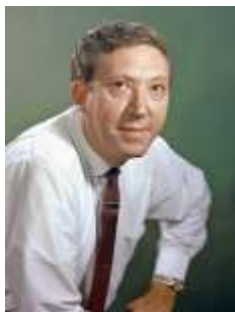
Юрий Никулин – народный артист СССР