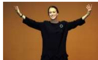
Майя Плисецкая – народная артистка СССР