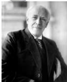
Константин Станиславский – основатель системы обучения актерскому мастерству

Успешные люди обладают не только высоким интеллектом (IQ), но и умением управлять своими эмоциями (EQ).