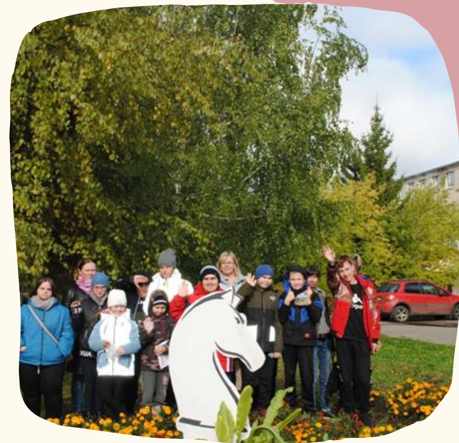
Результат работы над проектом