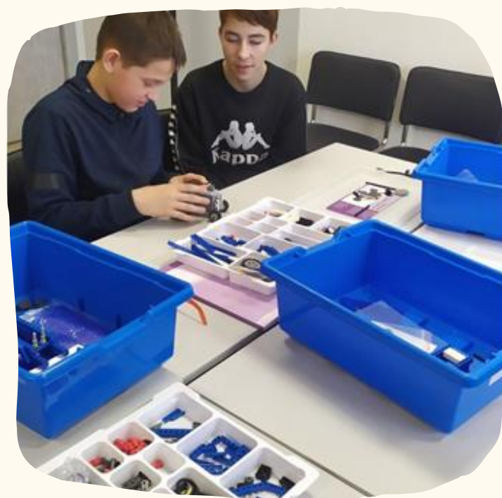
Мастерская современных идей