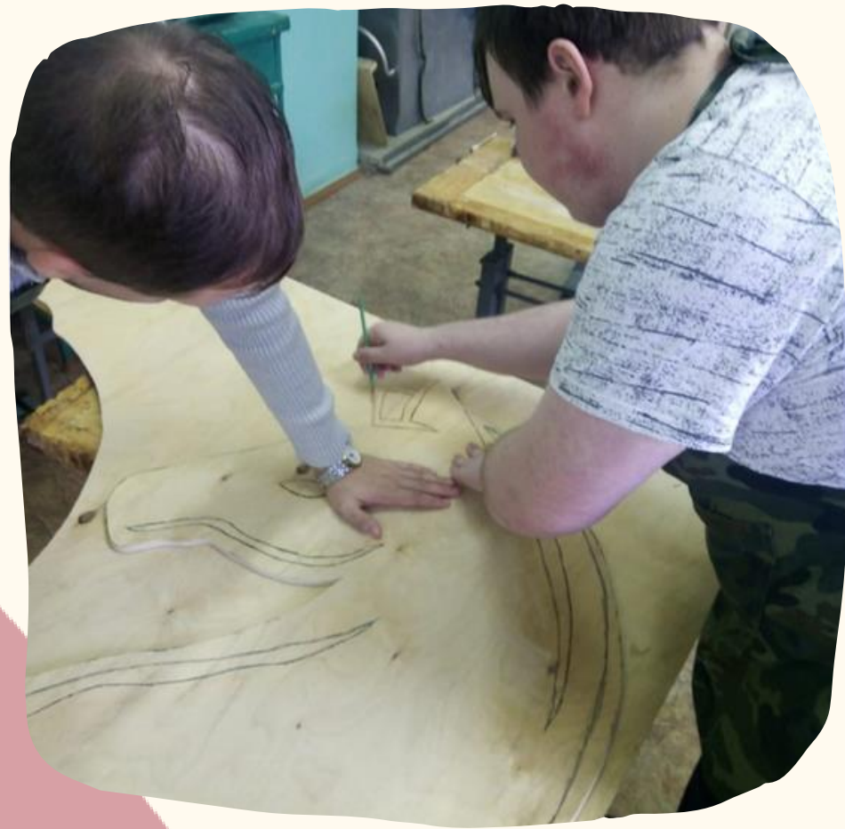
Работа в столярной мастерской