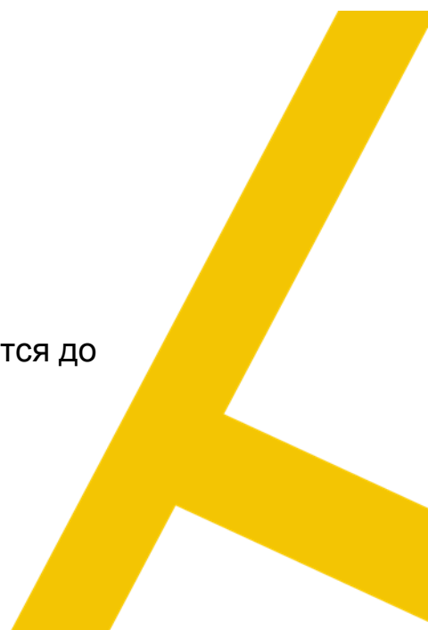
График проведения экспертизы согласовывается с экспертами и доводится до сведения участников Конкурса не позднее 17 апреля (включительно)