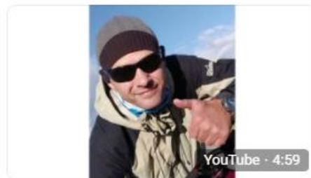
"Визитная карточка" участника а Вдови... авская область назад