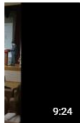
м" авская область назад