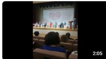
Педагогическая риторика "Сердце отдаю детям" Ярославская область 125 просмотров · два года назад