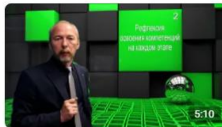
Моё педагогическое послание профессиональному сообществу... "Сердце отдаю детям" Ярославская область 13 просмотров · два месяца назад