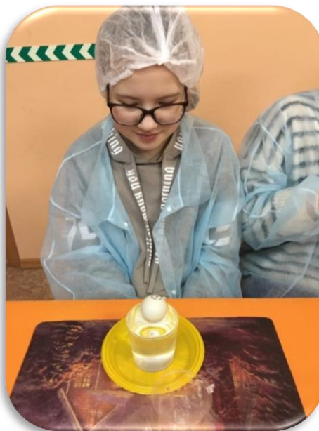
Инженер - физик