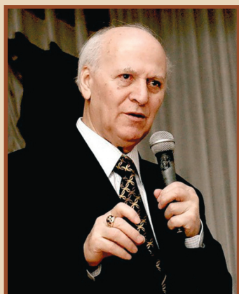
Ш. А. Амонашвили

Редаклегия журнала «Образовательная панорама»