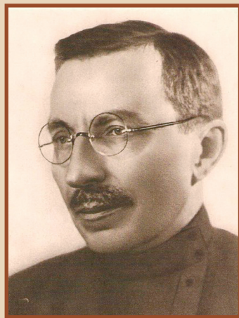
А. С. Макаренко

Выдающихся педагогов очень много. Каждый из них внес что-то важное в науку и практику. Для меня открыли педагогику много лет назад К. Д. Ушинский и А. С. Макаренко. Особенно Антон Семенович Макаренко . Я прочитала все его труды и считаю, что многие практические вопросы воспитания: о развитии коллектива, самоуправлении, организации трудовой деятельности, взаимодействии детей разного возраста — лучше и доступнее никто не изложил. Например, если педагог хочет научиться проводить собрание детского коллектива, то ему в первую очередь нужно прочитать об этом у А. С. Макаренко. Идеи, советы, которые дает Антон Семенович родителям, и сегодня чрезвычайно актуальны.