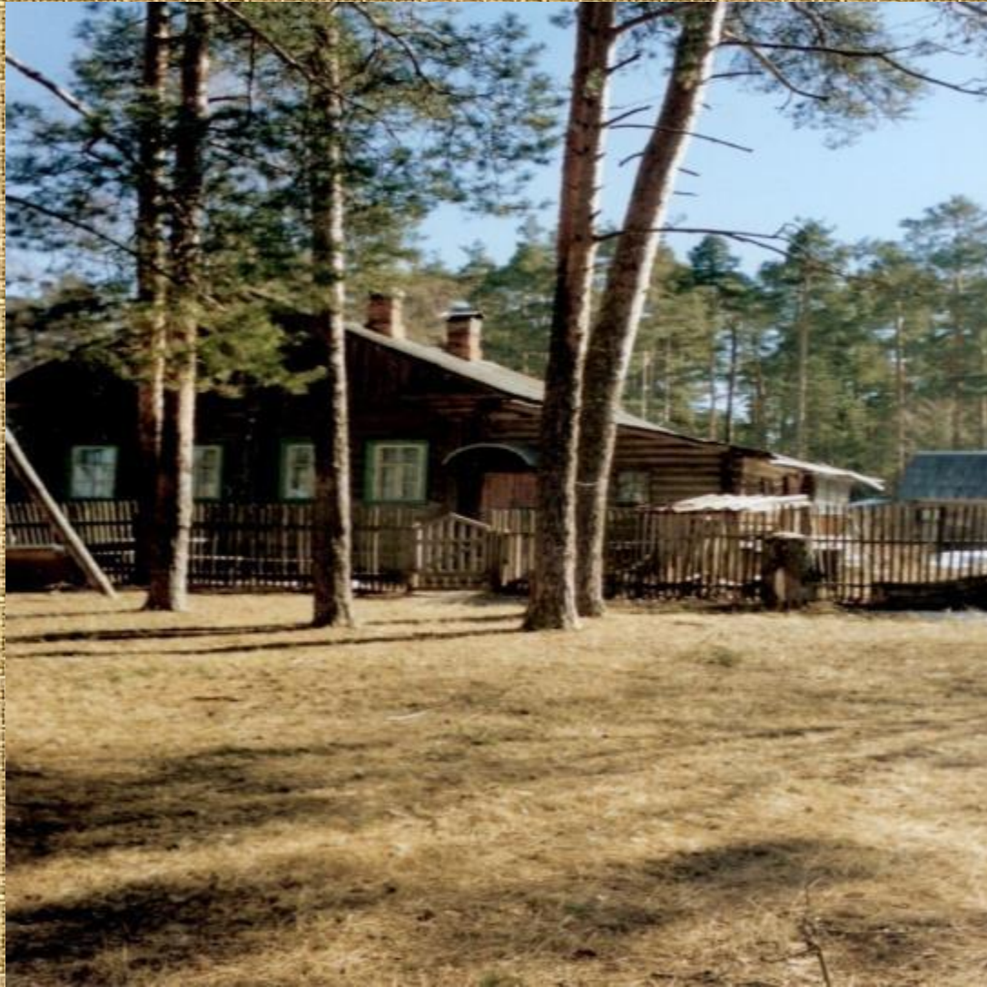
Дом, в котором жил М.М. Пришвин