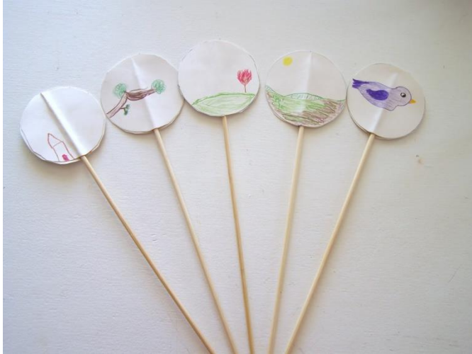
«Чижик - Пыжик» Ю.Иванова