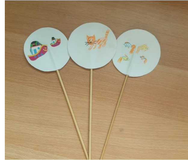
«Котобой, или Приключения котов на море и на суше» А.Усачев