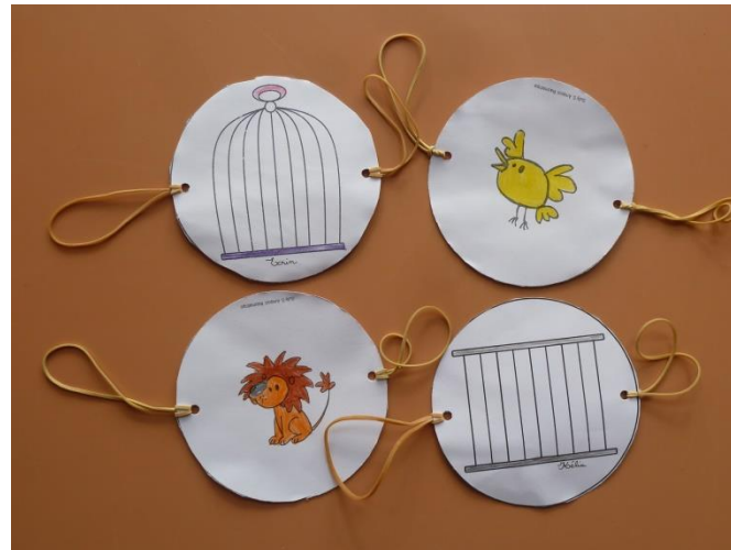
«Приключения в зоопарке» А.Усачев