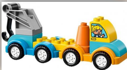
Строительные машины «Дупло»