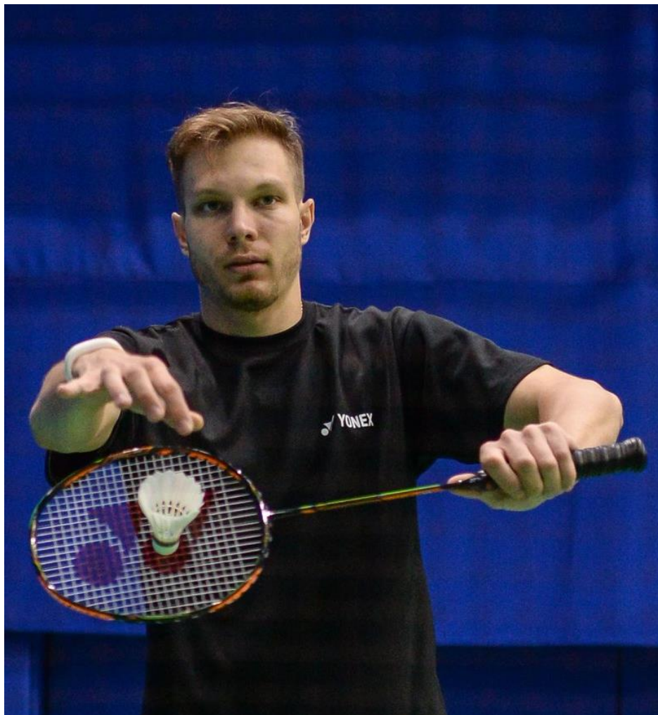
Иван Сазонов Российский игрок в бадминтон