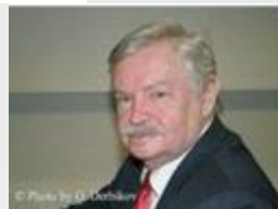
Альберт Лиханов—автор романа «Мой генерал»

Ученикам было предложено в процессе чтения подумать над проблемными вопросами.