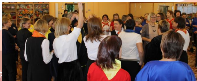
онф рии к практике: векторы развития»