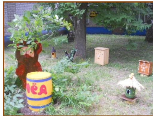
Станция «В гости к пчёлам»