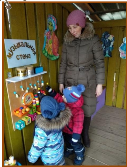
Станция «Музыкальная стена»