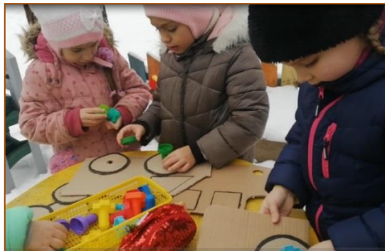
Станция «Птичья Столовая»