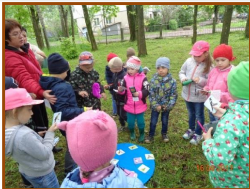
Станция «Островок размышлений»