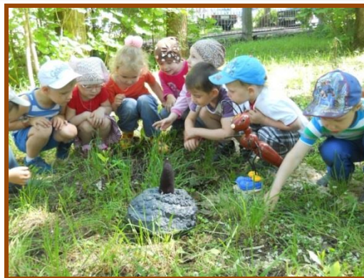
Станция «Бюро находок»