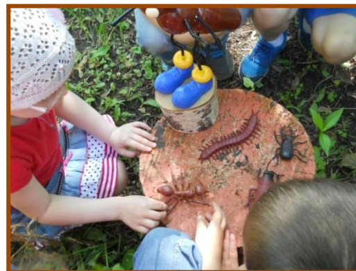
Станция «В стране насекомых»