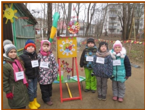
Станция «Поляна Сказок»