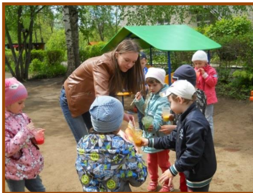
Станция «Владения мыльного пузыря»