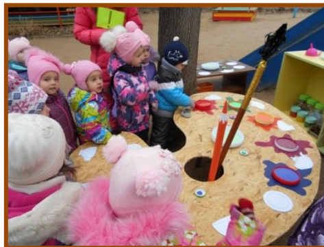
«Станция «Волшебная палитра»