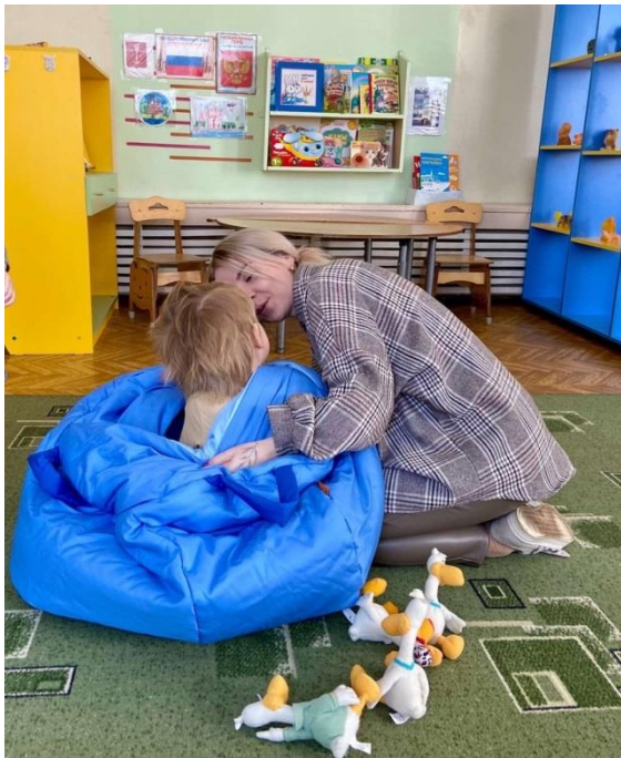
Рис. 17. Игры в «яйце»

Поэтому одним из вариантов применения данного сенсорного оборудования являются речевые игры, которые могут быть использованы для запуска речи у неговорящих детей или при коррекции нарушений вербальной коммуникации.