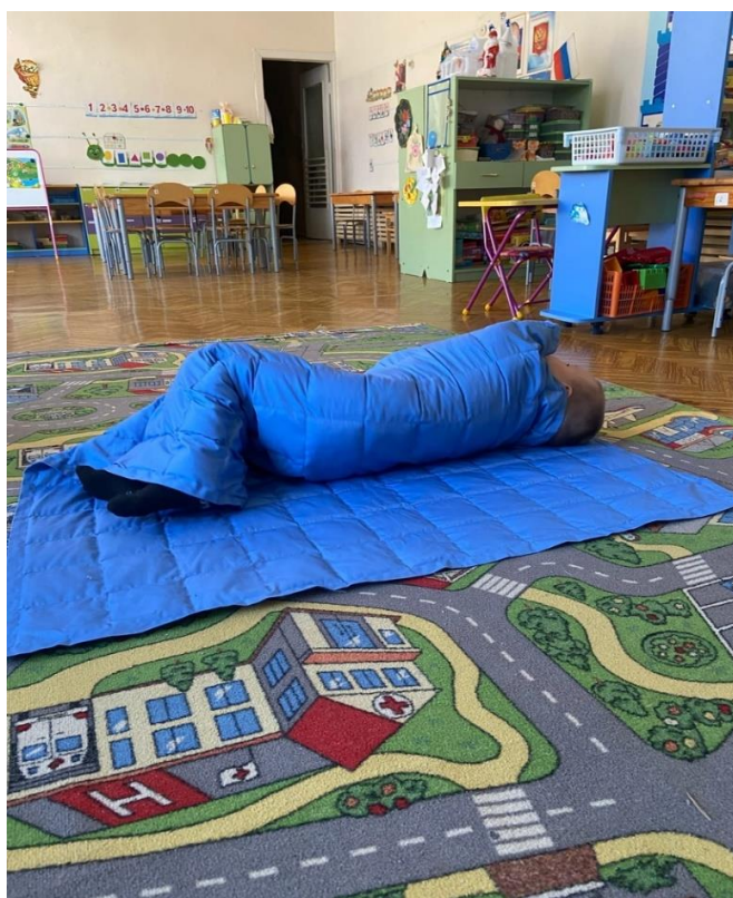
Рис. 16. Игры с одеялом: игра «куколка»

Цель данной игровой серии – стимулирование тактильной, кинестетической чувствительности, поиск способов управления своим телом, пространственные ориентиры в своем теле и вокруг себя (рис. 16).