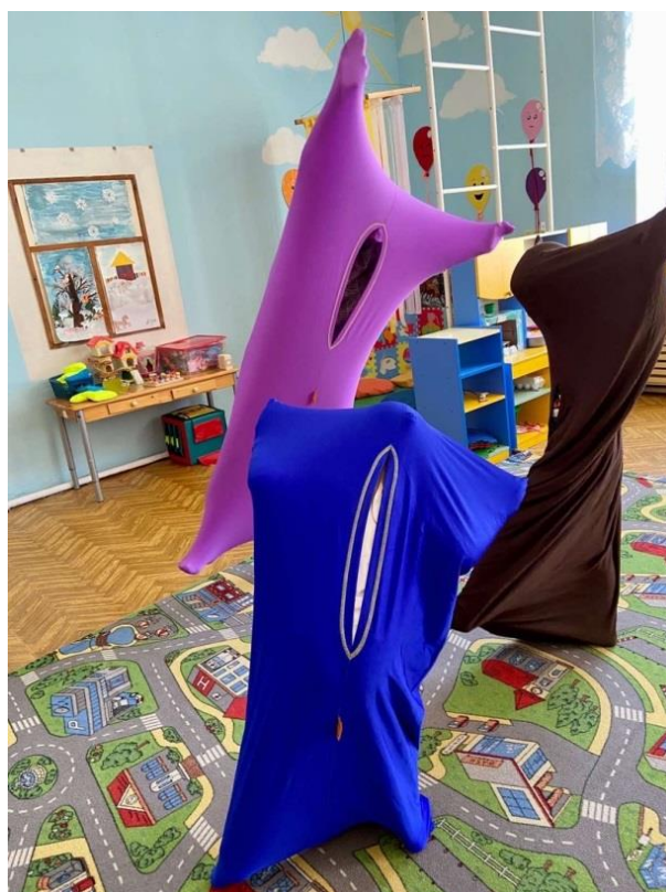
Рис. 19. Игры с «Чулком совы». «Колдунчики»