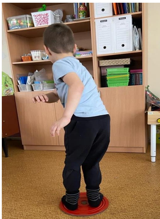
Рис. 1. Вращение на диске

торое время привыкает к вестибулярным ощущениям. Затем ему предлагают взять игрушку со стула (можно с пола) и назвать её в тот момент, когда он приблизится к стулу. Амплитуда движений вперед-назад постепенно увеличивается, может увеличиться и скорость движений (все индивидуально). Когда ребенок на мяче откатывается назад, игрушку надо опустить в коробку. Набор игрушек определяется задачами речевого развития: например, собери всех животных или собери все предметы, в названии которых есть определенный звук и т. п. После того как все игрушки оказались в коробке, опустившись с мяча, можно еще раз рассмотреть, назвать собранные предметы и проверить правильность выполнения задания.