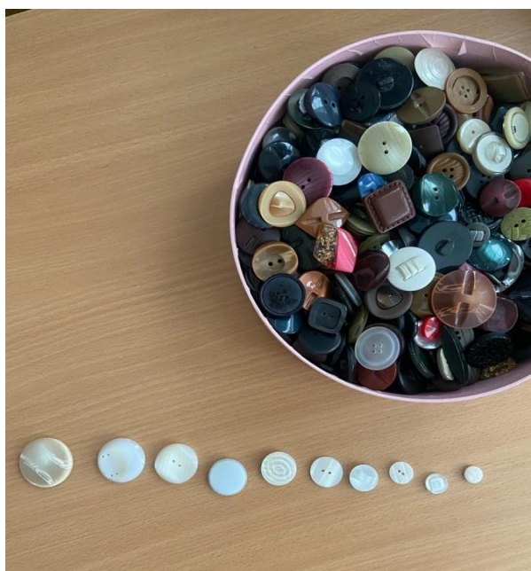
Рис. 5. «Копошилка» из пуговиц

Оборудование: «копошилка» из пуговиц (рис. 5).