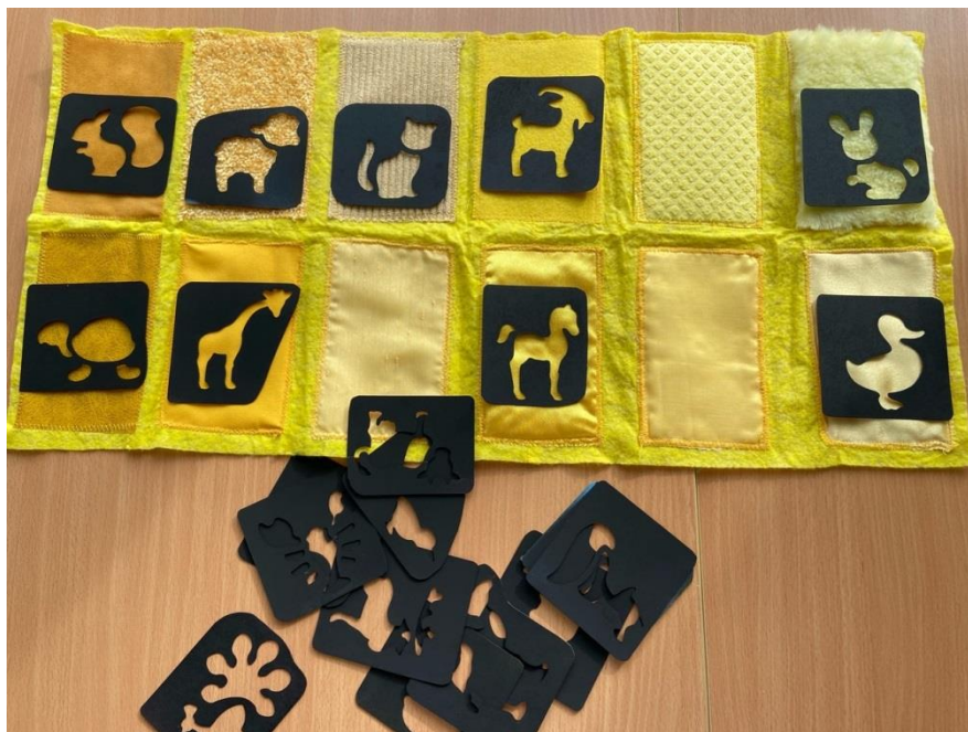
Рис. 8. Игра «Тактильные силуэты»

Накладывая трафарет на определенный фрагмент коврика, ребенок видит, как силуэт становится пушистым котом или лисой, мягким медвежонком или гладкой атласной уточкой. Подбирая тактильный образ к изображению, а затем изменяя его, ребенок расширяет сенсорный опыт и уточняет представления о предметах, соотносит их с речевыми обозначениями.