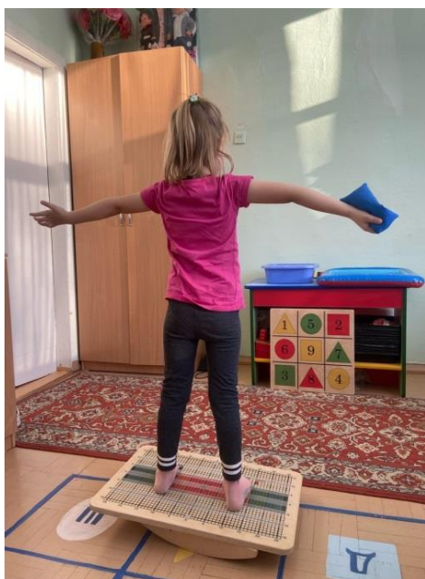
Рис. 2. Выполнение упражнений на балансире

Все упражнения выполняются из положения стоя, строго по разметке на балансире. Педагог показывает упражнения, ребенок повторяет, темп средний. Входе выполнения упражнений показ можно прекратить, ребенок выполняет самостоятельно (рис. 2).