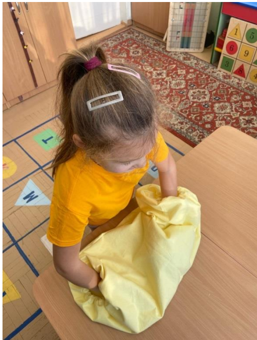
Рис 9. Руки в туннеле

то игры в «туннеле» необходимо включать в занятия как можно чаще. Оба варианта способствуют активизации речи, поэтому, организуя такие игры, особое внимание стоит обратить на качественную речевую нагрузку. Игры в «туннеле» подходят для запуска речи у неговорящих детей, расширения и активизации словарного запаса, стимулируют формирование фразовой речи.