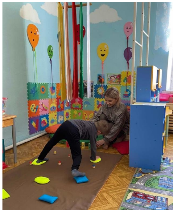
Рис. 14. Играем в «Лежачий скалодром» на занятии

Всем известны такие приемы организации перехода группы детей в другие помещения, как, например, крадемся в кабинет, как мыши, идем из спальни в позе паука (на руках и на ногах, вверх животом) и т. п. Развивая эту идею, создаем на пути помехи. Получается своеобразная «полоса препятствий». Ее не трудно соорудить, используя туннель, большие коробки, канат, крупные мягкие модули, тактильные дорожки, детскую мебель, обручи, игрушки и другое. Основные принципы построения «полосы» - доступность и безопасность для детей.