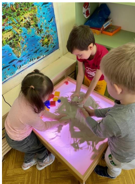
Рис. 7. Силуэты на песке