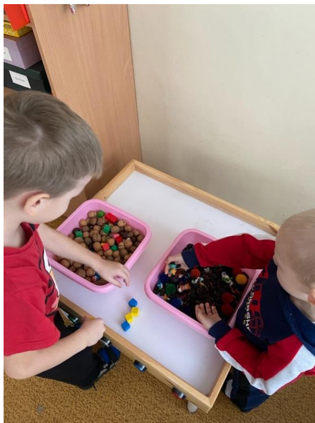
Рис. 4. Игры с тактильными «копошилками» в паре

Крупяная «копошилка» – самая легкая, деликатная, оказывающая мягкое давление на кожу и мышцы рук, спокойное цветовое и шумовое воздействие, состоящая из риса, гречки или пшена в произвольных пропорциях. Практика показывает, что дети с удовольствием пересыпают, разгребают, разделяют содержимое руками или прибегают к использованию палочек, дощечек, ложек, стаканчиков и прочих предметов. С крупяными «копошилками» можно организовать разнообразные речевые и математические игры, например: «Сколько детенышей у мамы?», «Лесные домишки».