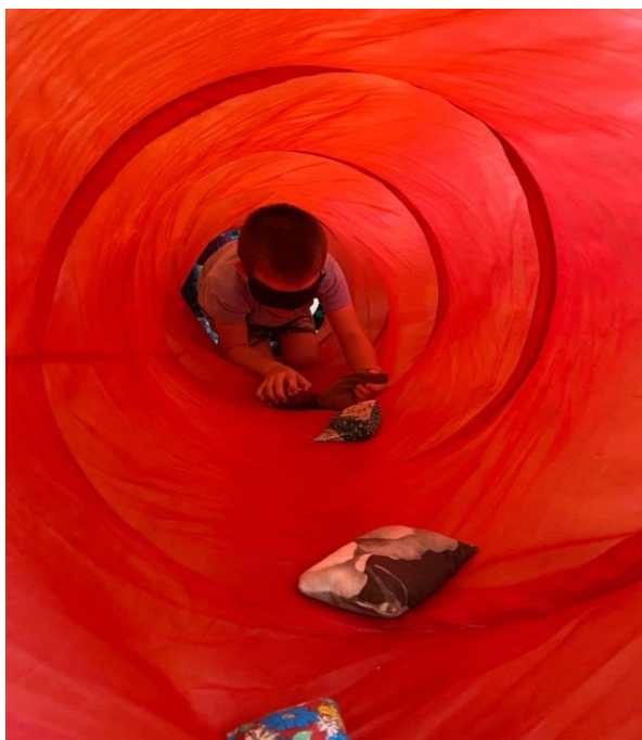
Рис. 15. Игра «Полоса препятствий или веселый беспорядок». Туннель

Показалось просто? Можно усложнить, перенося мешочки на голове или под мышками, передвигаться парами, называя при движении, например, животных, птиц, деревья.