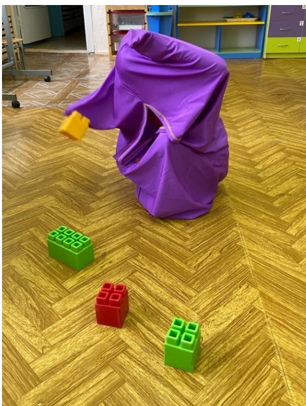
Рис. 18. «Чуллок совы»

«Чуллок совы» – это большой чехол из специальной эластичной ткани (рис. 18.), являясь необычной сенсорной средой, заставляет ребенка яснее ощущать себя, «прислушиваться» к своим движениям, подстраивая их к новым тактильным условиям. Цель игр с «Чулком совы» – усиление проприоцептивной и тактильной чувствительности, тренировка преодоления препятствий, улучшение пространственного ориентирования, ускорение формирования схемы тела, уменьшение тактильной гиперчувствительности, вовлечение ребенка в игровую деятельность, формирование навыков социального взаимодействия. С его помощью ребенок превращает свои действия в фантастические. В нем можно изображать разных героев, кувыркаться, бегать, ползать, что-то искать. «Чуллок совы» успешно применяется в работе над коррекцией гиперактивности, гипер- и гипотонуса, дефицита внимания. «Чуллок совы» может быть использован как спортивный снаряд для развивающих и спортивных игр.