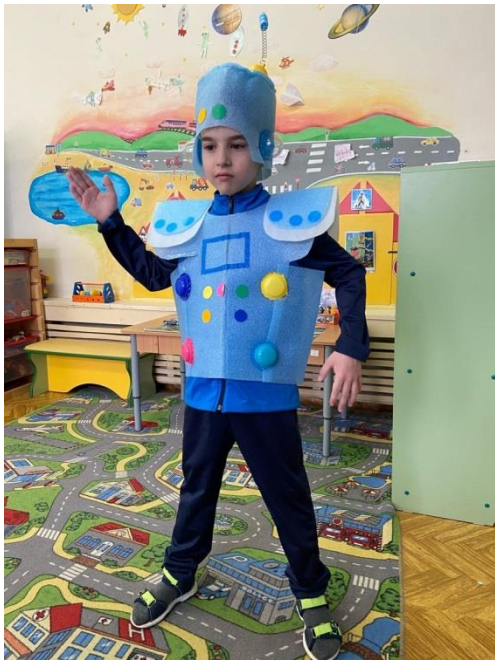
Рис. 10. Игра «Робот»