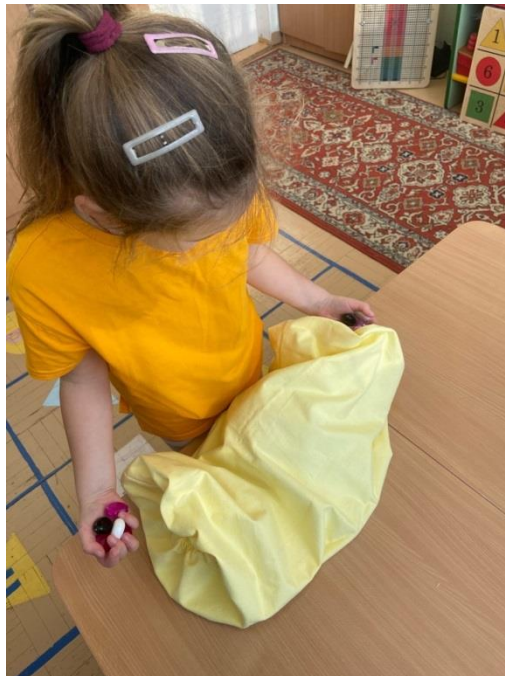
Рис. 10. Игры с туннелем

Попросите дошкольника взять в руки яблоко и описать его. В первую очередь он расскажет о том, каким он его видит: красное, большое, даже вспомнит его вкус. Однако свойства яблока, которые определяются с помощью тактильных рецепторов: гладкое, холодное, тяжелое - осознаются ребенком, если его подвести к этому направляющим вопросом. Совсем по-другому воспринимается яблоко в «туннеле».