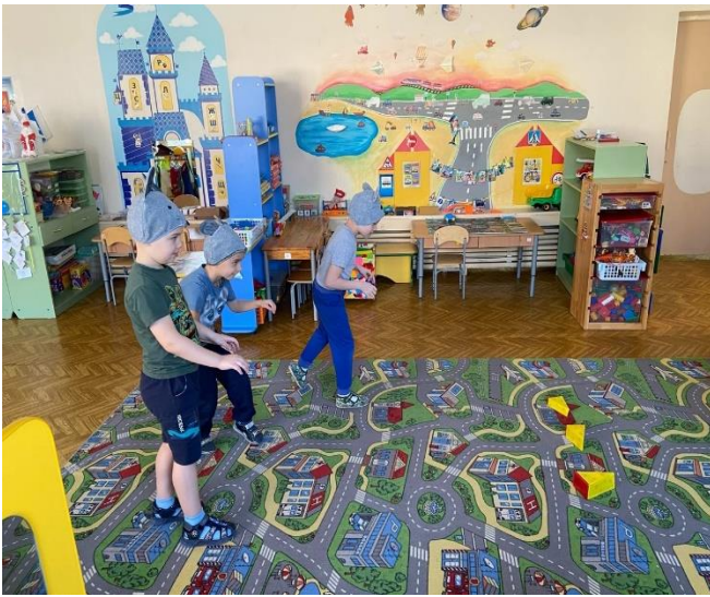
Рис. 12. Игра «Стоп-кадр». Мыши подбираются к сыру

Для обогащения проприоцептивной системы необходимо получать и обрабатывать новые телесно-двигательные ощущения, чтобы лучше чувствовать свое тело и его возможности. Незнакомые ранее способы преодоления препятствий, передвижения в необычных позах стимулируют проприоцепцию, обогащают двигательный опыт.