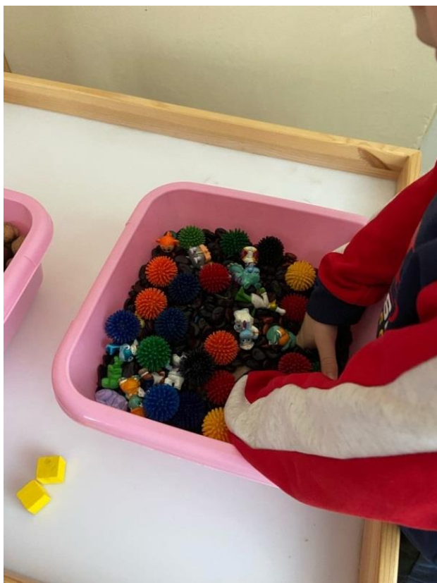
Рис. 3. Тактильная «копошилка»