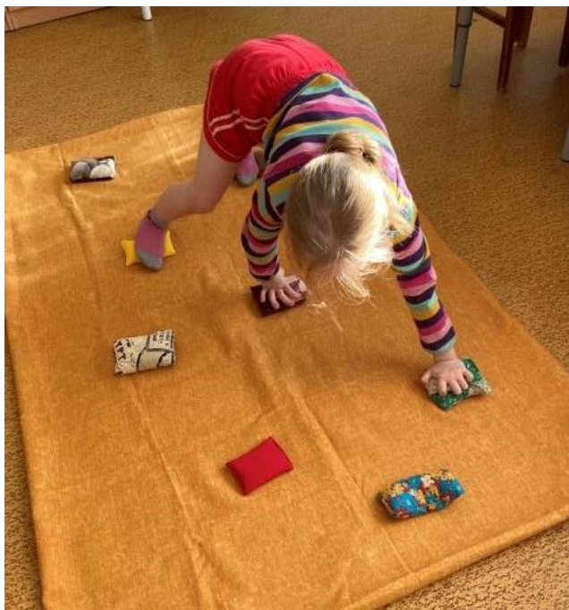
Рис. 13. «Лежачий скалодром»

регулирующие направление движения. Под мешочками или рядом с ними могут спрятаться «сокровища» или «тайная информация», которую надо запомнить и потом воспроизвести, для этого используются предметные картинки или мелкие предметы (камешки, фишки, игрушки) [6].