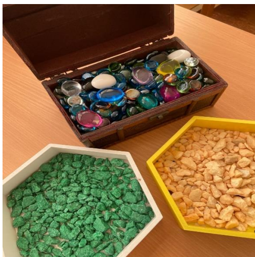
Рис. 6. «Копошилка» с камешками Марблс