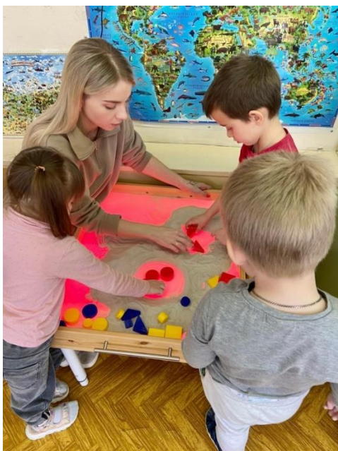
Рис. 6. Игры с песком