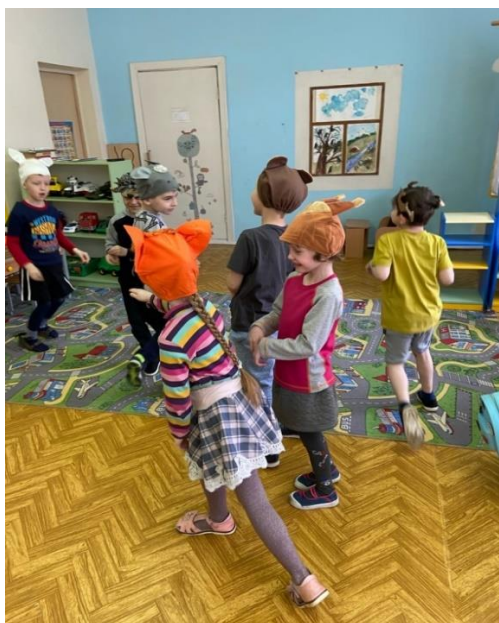
Рис. 11. Игра «Фоторепортаж»

Игра «Фоторепортаж» (рис. 11) «вписывается» в любую тему занятия. Дети с удовольствием отправляются в различные путешествия и через позы, имитацию движений воображаемых объектов создают целостную картину – фотографию. Например, путешествуя по лесу, они изображают то растения, то насекомых, животных и птиц, передавая их характер и эмоции.