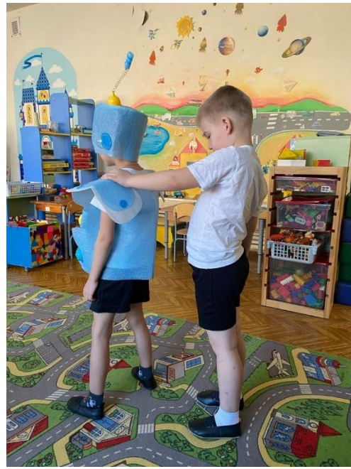
Рис 11. Управление «Роботом»