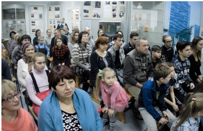
На встрече в музее

Особенно много потрудились сотрудники накануне столетия Федора Абрамова. В музее проводились творческие встречи, конкурсы, были подготовлены новые выставки.