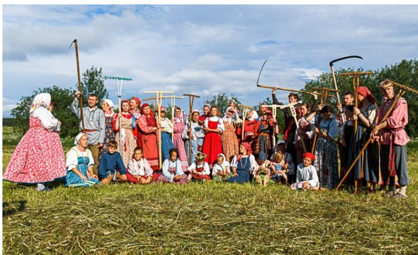
На фестивале «А в Пекашино ставят стога»

Начиная с лета 2013 года совместно с Архангельским областным краеведческим музеем и Веркольским народным хором проходит фольклорный фестиваль «А в Пекашино ставят стога», в котором принимают участие народные коллективы Пинежья, поэты и прозаики из различных городов России.