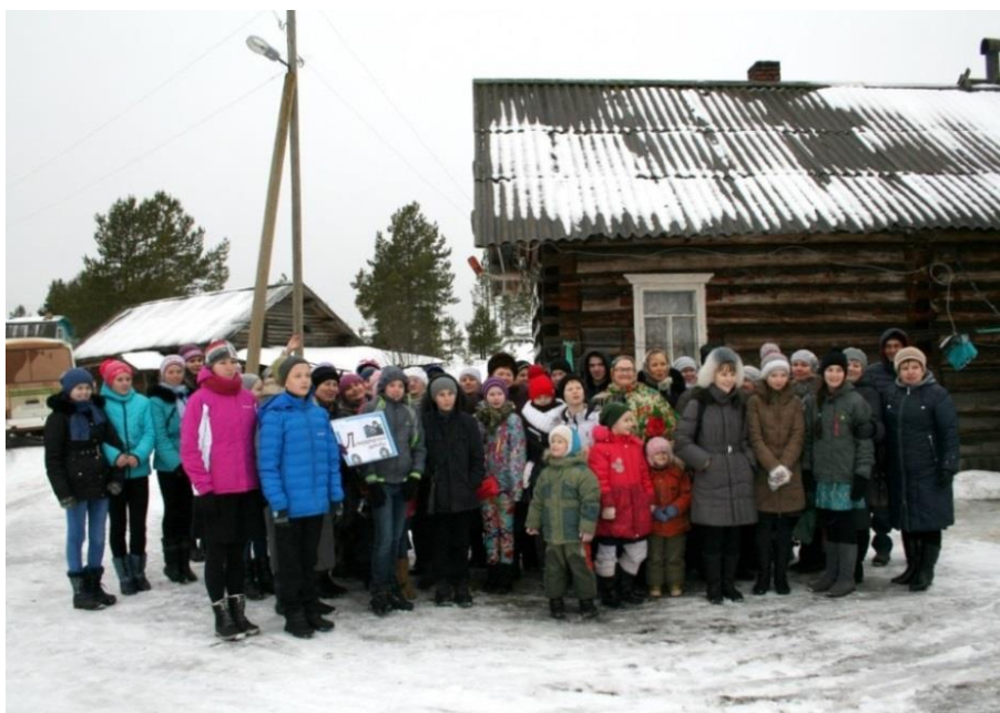
Литературный автобус «Из колена Аввакумова» 28 ноября 2015

С июня по ноябрь 2015 года по Пинежью путешествовал Литературный автобус. Участники поездок знакомились с историей создания и прототипами произведений Федора Абрамова. Это был совместный проект музея и Веркольского прихода святителя Николая Чудотворца – победителя международного грантового конкурса «Православная инициатива 2014-2015».