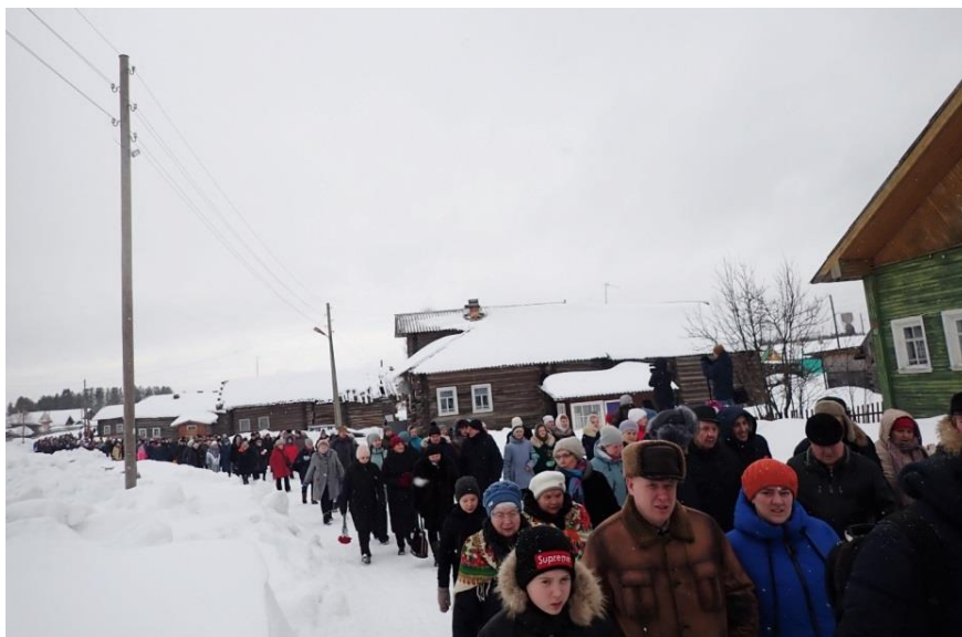
На улице Федора Абрамова 29 февраля 2020

Как ни трудна дорога в Верколу, в музей ежегодно приезжает очень много людей. Среди посетителей в основном учащиеся местных школ, но едут из Архангельска, Санкт-Петербурга, Москвы и других российских городов. Развитию массового туризма мешает отсутствие необходимой инфраструктуры. Но в последние годы эта проблема частично решена. Сейчас в Верколе уже действуют два гостевых дома.