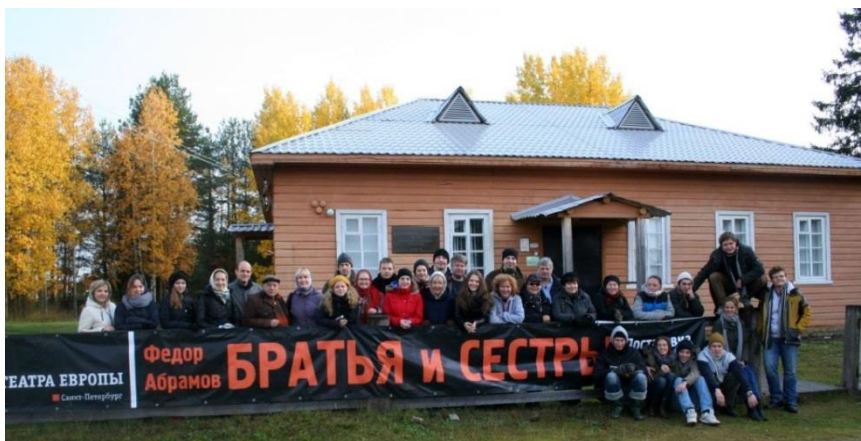
Артисты Малого драматического театра – театра Европы у Литературно-мемориального музея Ф. А. Абрамова Веркола, сентябрь 2014

Начиная с лета 2013 года совместно с Архангельским областным краеведческим музеем и Веркольским народным хором проходит фольклорный фестиваль «А в Пекашино ставят стога», в котором принимают участие народные коллективы Пинежья, поэты и прозаики из различных городов России.