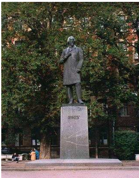
Памятник Н. А. Некрасову в Петербурге

Покидая Санкт-Петербург, мы посмотрим на памятник Н. А. Некрасову.