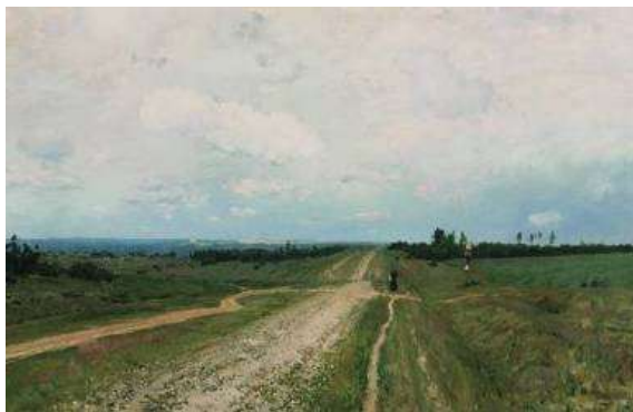
И. Левитан. Владимирка

А теперь, уважаемые слушатели, давайте все вместе вспомним, что около барского дома проходила многолюдная и бойкая, столбовая ярославско-костромская дорога. Некрасов, выбравшись тайком за ограду усадьбы, знакомился на дороге со всяким рабочим людом: с печниками, малярами, кузнецами, землекопами, плотниками, переходившими из деревни в деревню, из города в город в поисках работы.