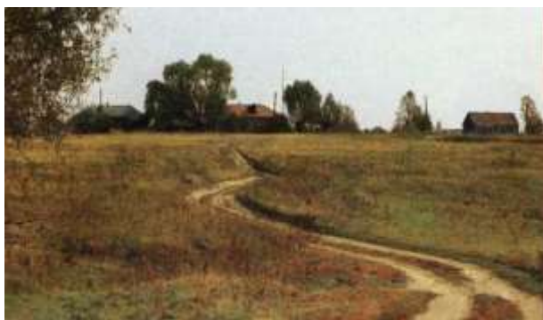
Окрестности села Грешнево

Этот момент жизни поэта и общение с крестьянскими детьми оказали влияние на его творчество.