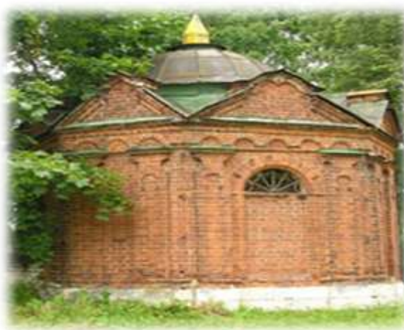
Семейная усыпальница Некрасовых

Неподалеку находится семейная усыпальница Некрасовых. В ней похоронен отец и другие родственники поэта.