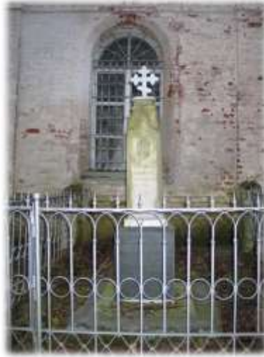
Памятник на могиле Е. А. Некрасовой около церкви села Абакумцево