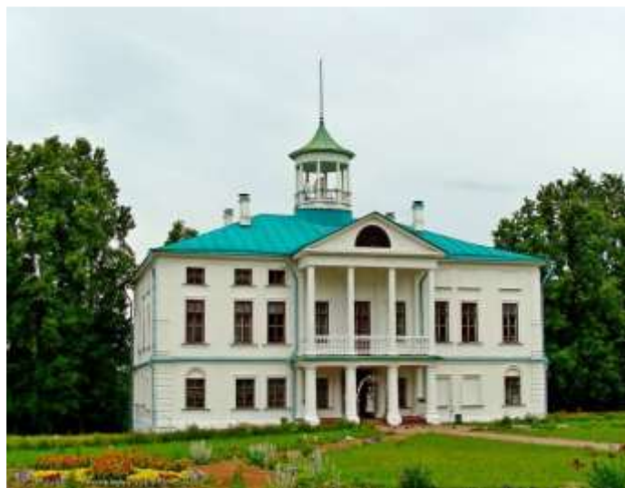
Государственный литературно-мемориальный музей-заповедник Н. А. Некрасова «Карабиха»

Расположена усадьба на Карабитовой Горе, потому и получила свое имя — Карабиха. Эта усадьба стала наиболее крупной в Ярославской губернии. Ее первоначальный вид сохранился до наших дней. Мы с вами видим на фотографии тот дом, который был и при жизни поэта. Сейчас здесь находится Государственный литературно-мемориальный музей-заповедник Н. А. Некрасова.