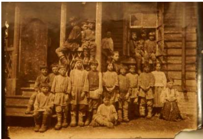
Первые ученики училища для обучения крестьянских детей