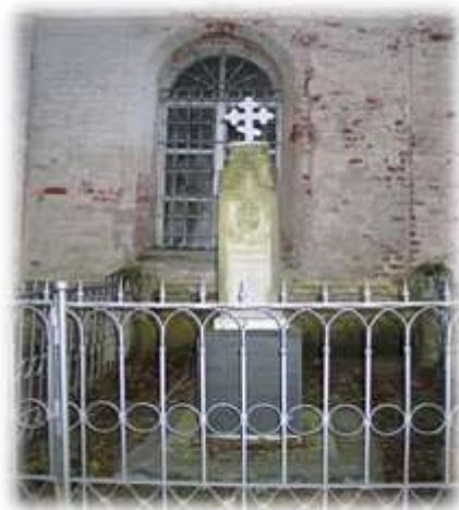
Могилы матери Н. А. Некрасова

У церковной ограды, напротив алтарной стены, на могиле Елены Андреевны Некрасовой, матери поэта, стоит белый мраморный памятник, увенчанный медным крестом.