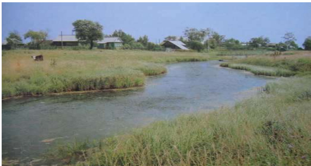
Река Самарка в окрестностях с. Грешнево

Поздней осенью 1824 года по Сибирке (так называли в народе низовой тракт — дорогу) забрызганный грязью экипаж вез семью майора в отставке Алексея Сергеевича Некрасова в село Грешнево.