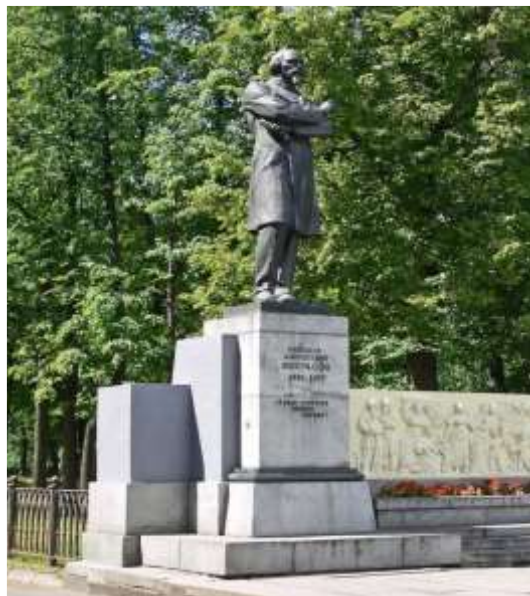
Памятник Н. А. Некрасову

В конце Волжского бульвара, в месте пересечения Первомайской улицы и Волжской набережной расположен памятник Николаю Алексеевичу Некрасову — русскому поэту, писателю, публицисту, учившемуся в Ярославле.