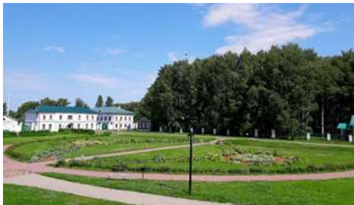
Парадный двор в Карабихе

ми и деревьями, у каждого объекта свое собственное место. А теперь посетим Нижний парк за домом. Это типичный английский парк — естественный, сначала он кажется запущенным, но тем не менее каждое насаждение здесь на выделенном специально для него месте. На краю Нижнего парка — водный каскад Гремиха, который создается ручьем, протекающим через Нижний и Верхний пруды.