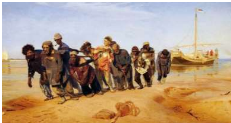
И. Е. Репин. Бурлаки на Волге

Н. А. Некрасов начал задумываться над жестокостью жизни. Рано ему открылась картина народного бедствия.