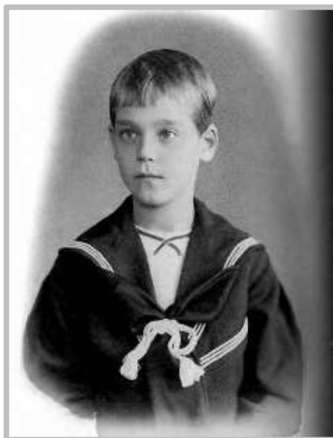
Детский портрет Н. А. Некрасова

Николай Алексеевич рано начал сочинять стихи, с 6–7 лет. Он вспоминал, что свое первое стихотворение написал для своей матушки в день ее рождения.