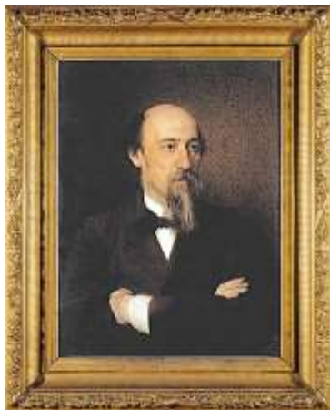
И. Н. Крамской. Портрет Н. А. Некрасова

Перед вами его портрет, созданный художником И. Н. Крамским. Это один из типичных портретов, на котором поэт изображен со скрещенными на груди руками. Никаких лишних эмоций на лице, сосредоточенный взгляд чуть в сторону: только застывшая концентрированная вечность, в которую он погружен.