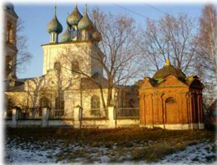
Церковь Петра и Павла

Верстах в 3–4 от Грешнева, в стороне от шоссе, идущего от Ярославля, на возвышенности, с вершины которой открывается великолепный вид на окрестности, раскинулось село Абакумцево. На краю Абакумцева, на берегу небольшого пруда, стоит церковь Петра и Павла. Среди ее прихожан была и семья Некрасовых.