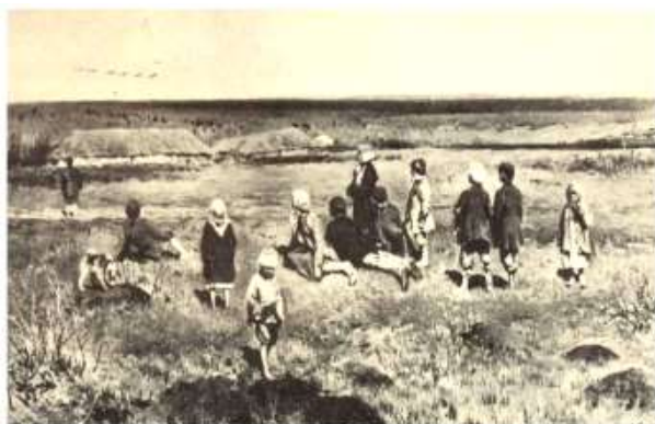
С крестьянскими детьми

Этот момент жизни поэта и общение с крестьянскими детьми оказали влияние на его творчество.