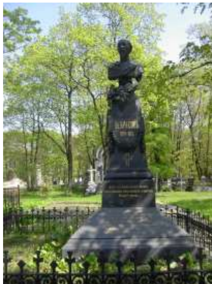
Постамент на могиле Н. А. Некрасова

Завершить экскурсию нам придется в Москве. Перед вами Новодевичье кладбище, постамент на могиле Н. А. Некрасова. Здесь морозным декабрьским утром 27 декабря 1877 года был похоронен поэт. Над его могилой с речами выступали В. А. Панаев и Ф. М. Достоевский.