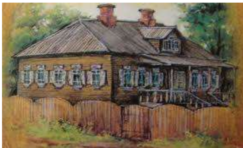
Усадьба Некрасовых в селе Грешнево

ловая), гостиная, кабинет, спальня, детская и девичья. В доме имелось семь окон с двойными рамами. Отапливался он голландской печью, имевшей изразцовую лежанку. Наверху находилась светелка с голландской печью. Дом был крыт тесом. Кроме господского дома в состав «усадебного строения» также входили баня, два каретных сарая, конюшня с денником, амбар с погребом, флигель с сенями, людская изба, скотный двор, погреб и др. (все эти постройки, за исключением крытых соломой людской избы, скотного двора и погреба, были покрыты тесом). К барскому дому примыкал сад, обнесенный «досчатым и бревенчатым забором», в котором имелась «беседка на столбах».