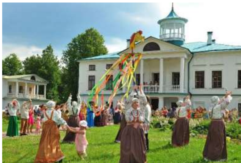
Всероссийский Некрасовский праздник поэзии в Карабихе