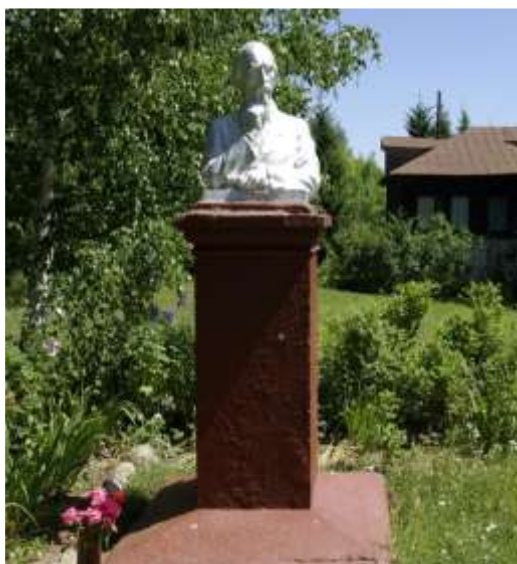
Бюст Н. А. Некрасова в селе Грешнево

Среди некрасовских мест России деревня Грешнево и село Абакумцево выделяются особо. «Всему начало здесь, в краю моем родимом!..», — так писал поэт о своей малой родине, где прошло его детство. Изображений грешневской усадьбы не сохранилось. Мы с вами, к сожалению, не сможем побывать в самом доме, но можем представить, как он выглядел.