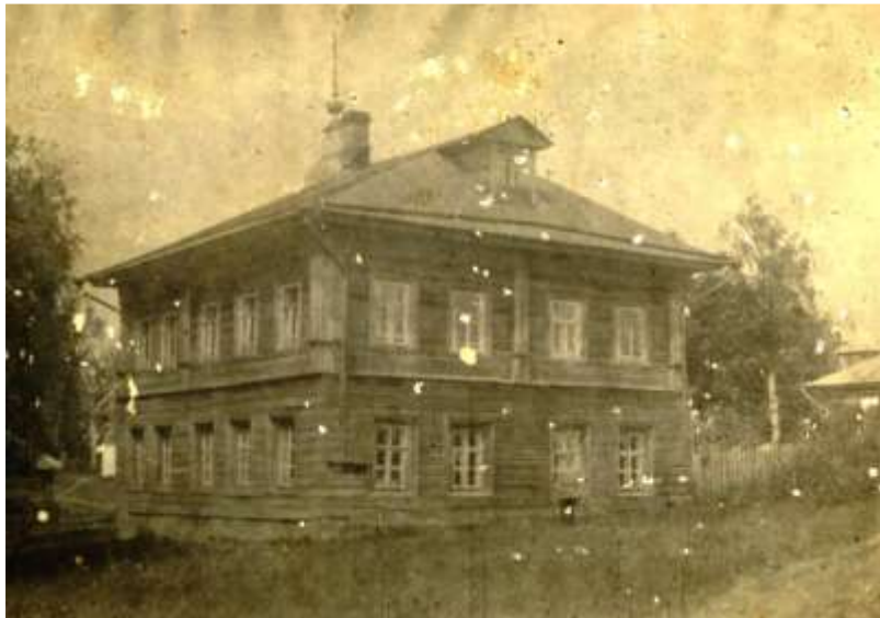
Училище (школа) для крестьянских детей в с. Абакумцево