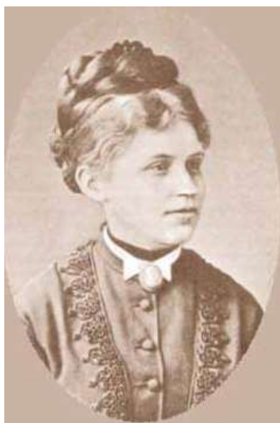
Портрет сестры Н. А. Некрасова

Перед вами портрет сестры Н. А. Некрасова.