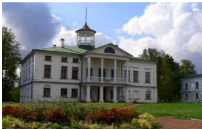
Государственный литературно-мемориальный музей-заповедник Н. А. Некрасова «Карабиха»

Вновь мы в окрестностях Ярославской области. В 15 километрах от Ярославля, недалеко от старинного села, протянувшегося вдоль Московско-Ярославского шоссе, на высоком холме, располагается музей-заповедник «Карабиха». Он относится к числу усадеб дворцового типа, характерного для эпохи классицизма. Музей включает жилые и хозяйственные постройки, 2 парка, регулярный и пейзажный, систему красивых прудов. Некрасов проводил здесь летние месяцы с 1861 по 1875 годы.