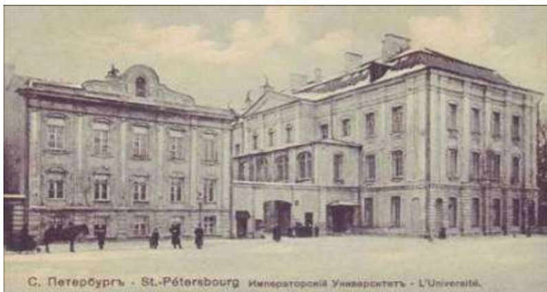
Здание Петербургского университета

В июле 1839 года Н. А. Некрасов пытался сдать вступительные экзамены на факультет восточных языков Петербургского университета, но потерпел неудачу. Однако в сентябре того же года он поступил «вольным слушателем» на отделение философского факультета.