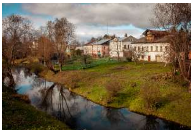
Окрестности села Вятское

В Вятском постоянно проводятся различные мероприятия: Всероссийский Некрасовский Праздник поэзии, фестиваль «Дни Некрасова в Вятском», организуется экскурсионный тур «Некрасовская Русь», фестиваль «Провинция — душа России», вдохновителем которого является известная оперная певица Любовь Казарновская.