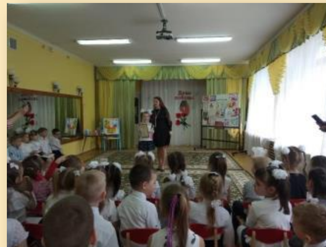
Конкурс детского творчества «Победный май»