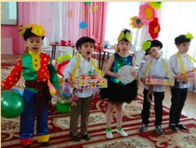
Проект «Знакомство с традициями русского народа»