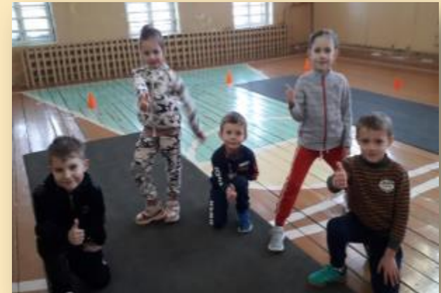
«Младше всех» ГТО для дошкольников