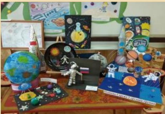
Выставка детского творчества «День космонавтики»