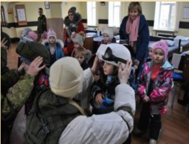
Экскурсия в воинскую часть