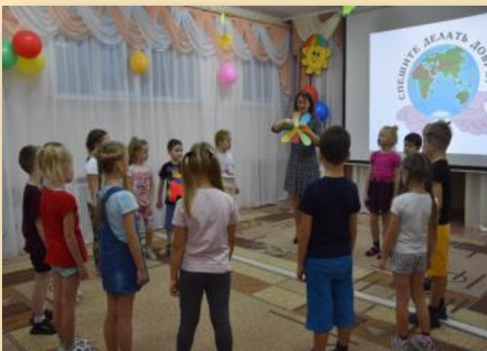
«Спешите делать добро», посвященное Международному Дню инвалидов