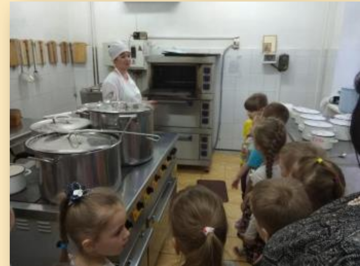
«Знакомство с трудом взрослых: профессия повар»