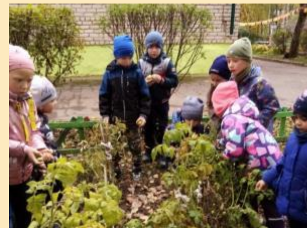
Труд в огороде