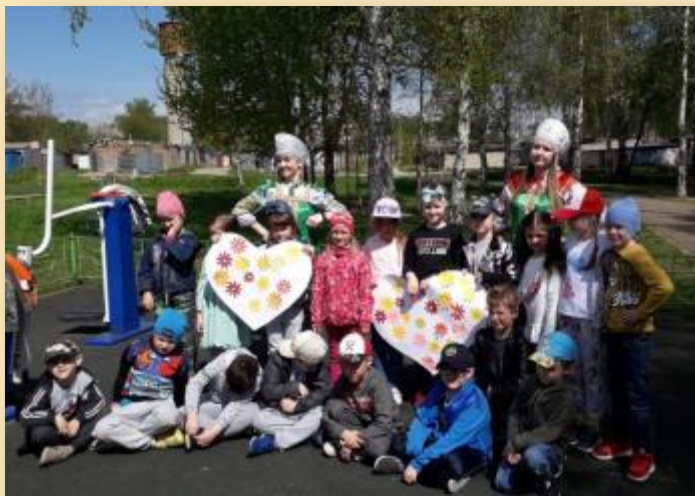
Всемирный день семьи с социальными партнерами Городской модельной библиотекой им. А.Невского