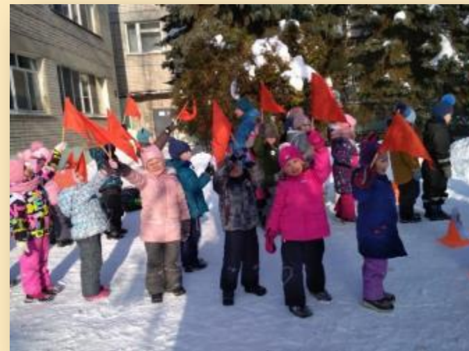
Физкультурный праздник «Снежный серпантин»