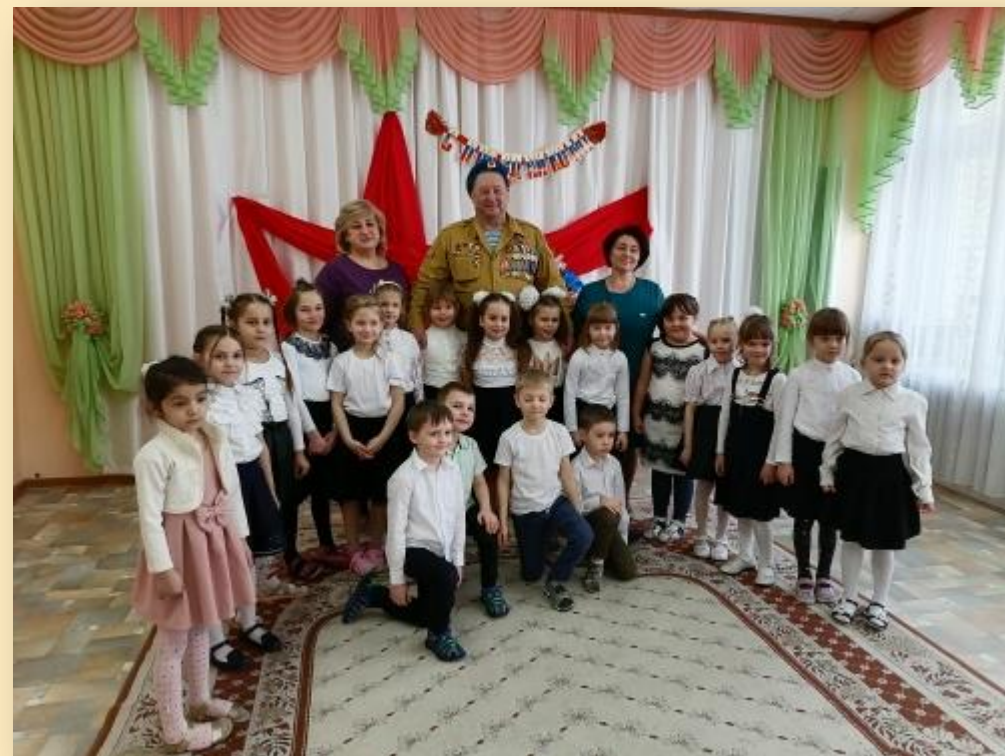
Встреча с ветераном боевых действий в Афганистане