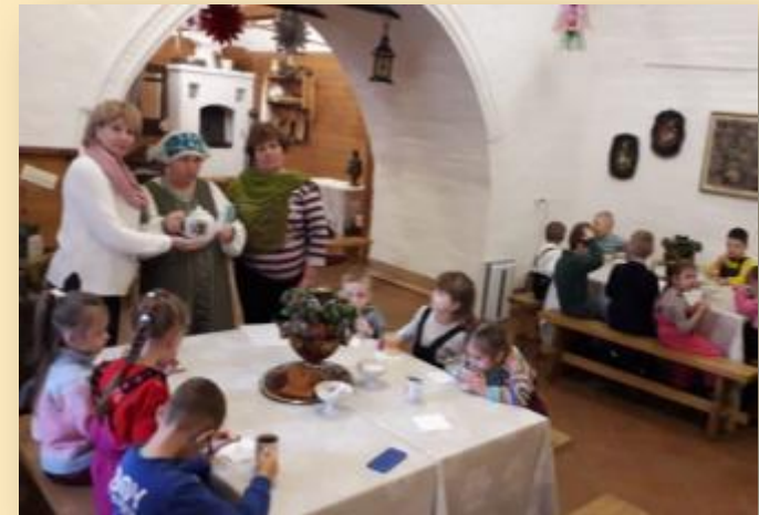
Экскурсия в музей