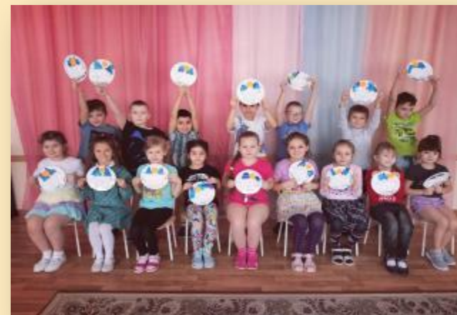
Марафон экологических событий