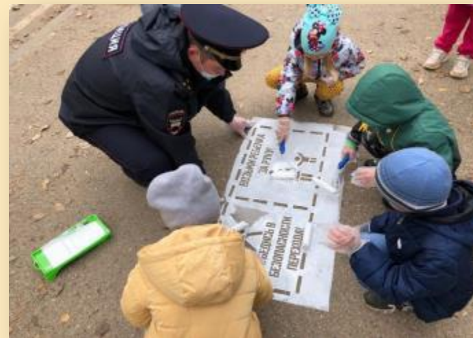
Акция «Возьми ребенка за руку» совместно с ОГИБДД