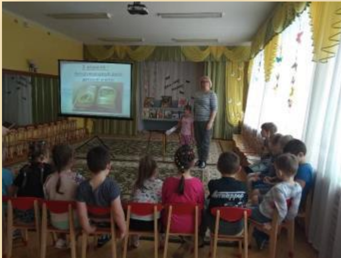
Международный день детской книги