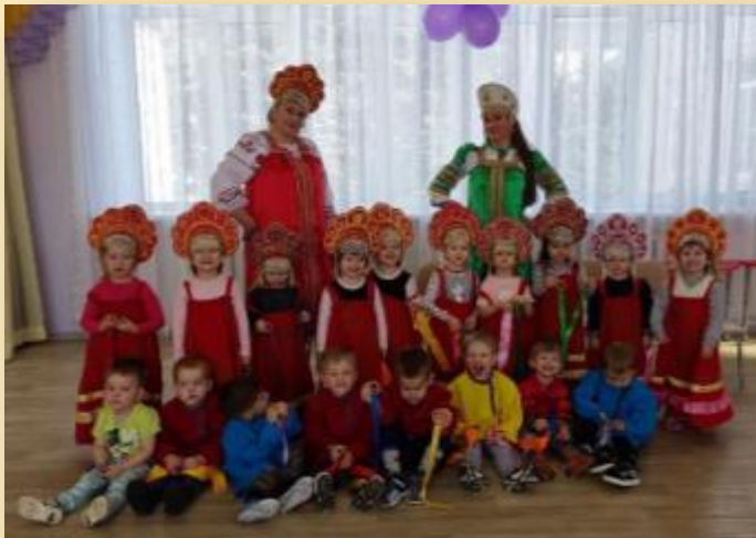
Масленица с социальными партнерами Городской модельной библиотекой им. А.Невского