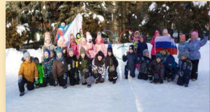
Олимпиада для дошкольников