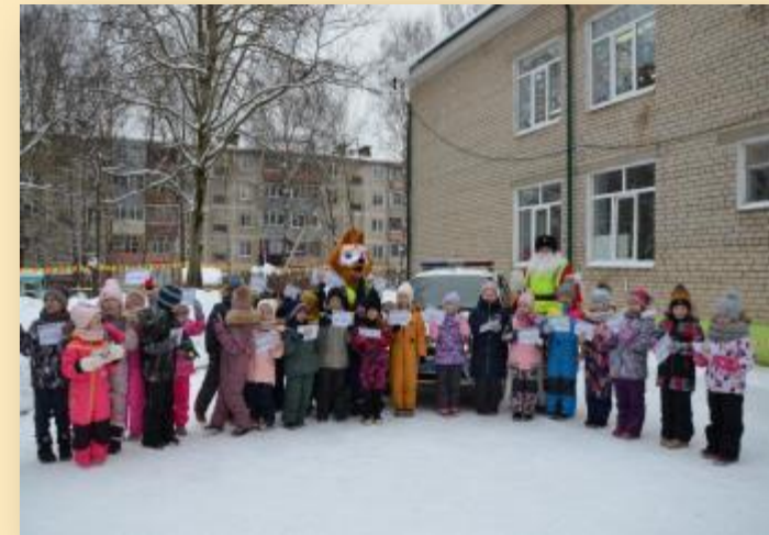
Полицейский Дед Мороз