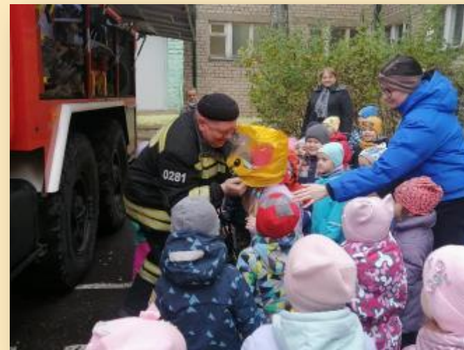
«Знакомство с пожарной машиной» совместно с Пожарной частью 28