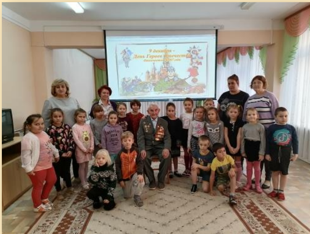
Встреча с ветеранами ВОВ, посвященная Дню героев Отечества