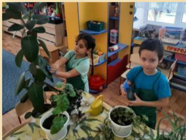
Труд в уголке природы