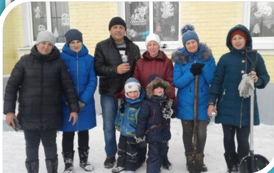
Смотр-конкурс «Лучший зимний участок»