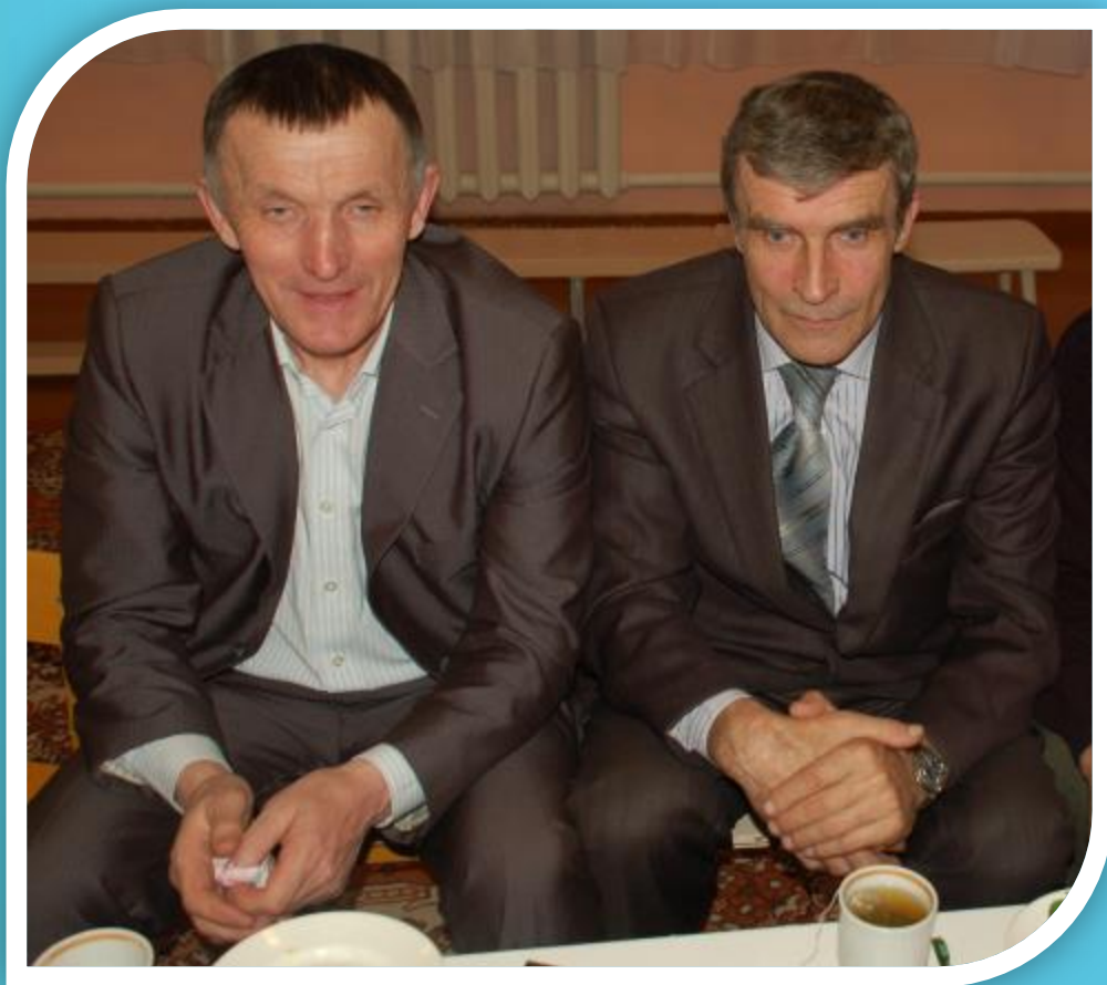
Главы сельских поселений села Октябрьское и станции Дрязги

На праздник приглашаются папы и дедушки воспитанников всех возрастных групп, неравнодушные к проблемам детского сада односельчане.