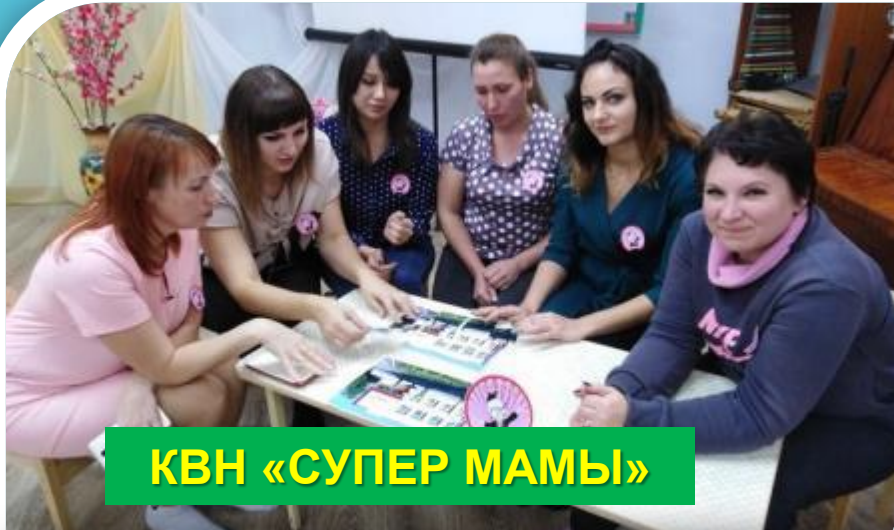
КВН «СУПЕР МАМЫ»