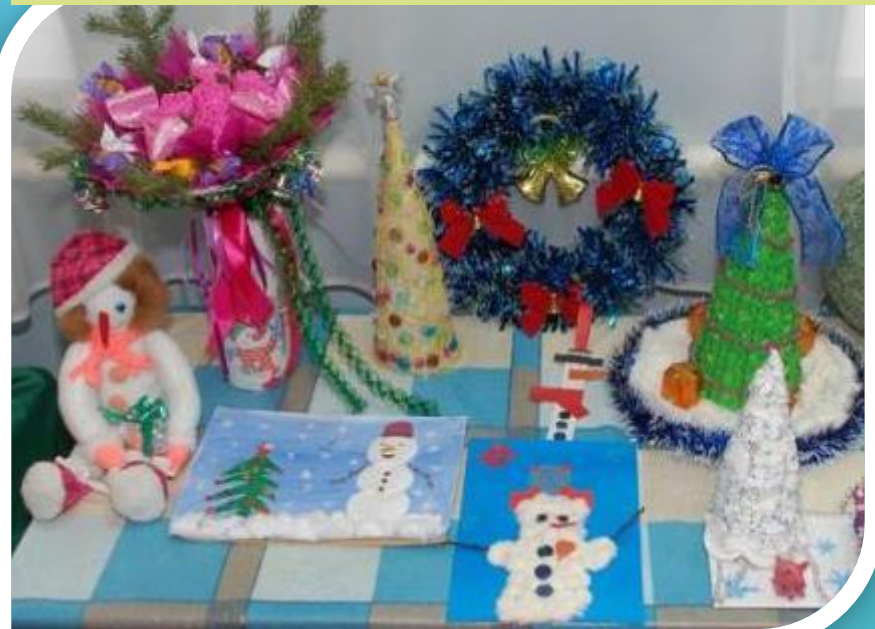
Конкурс «Вместо елки – букет»