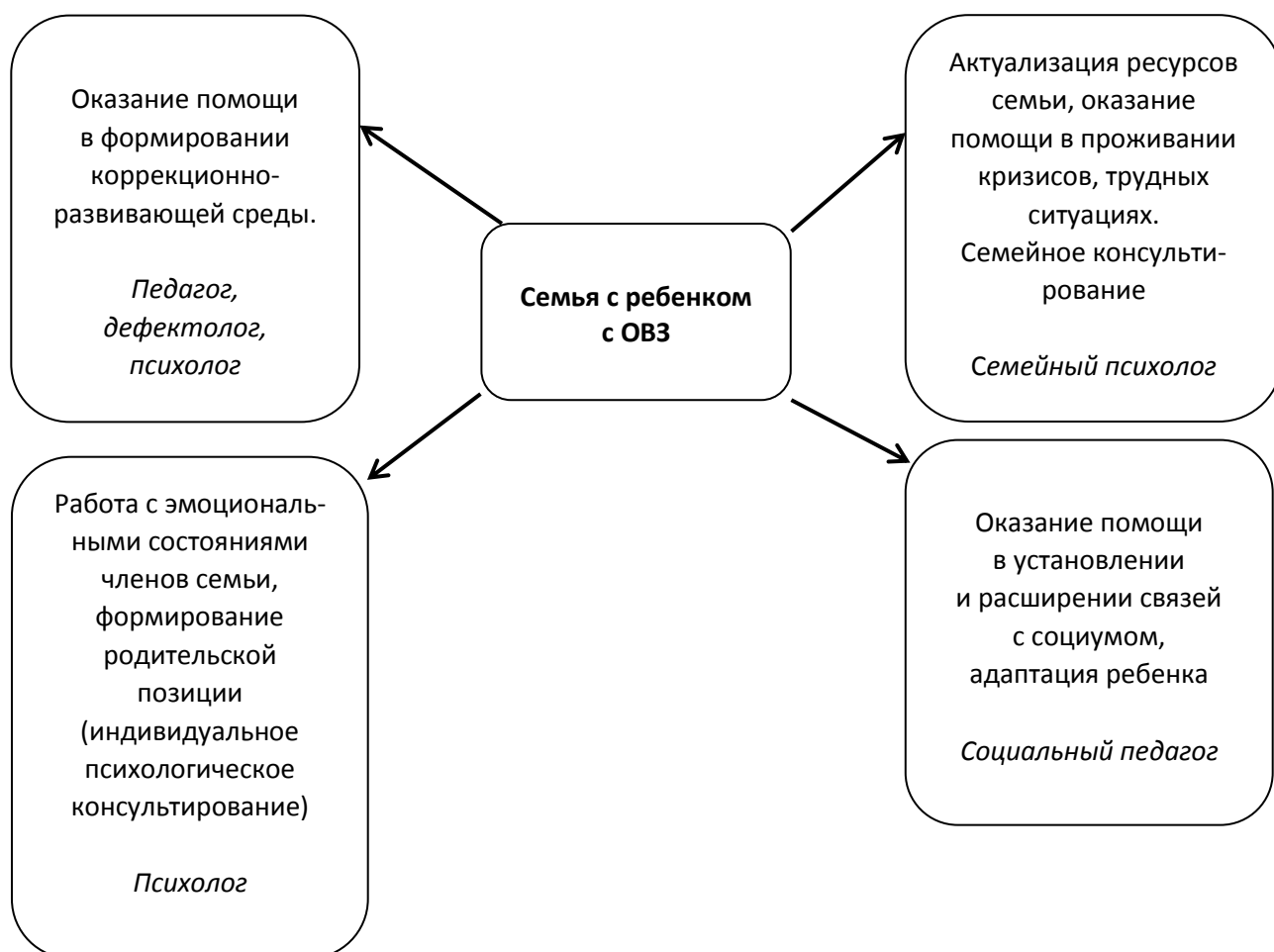
Рис. 2. Основные задачи специалистов образовательной организации в работе с семьей

6. Комплексность. Данный принцип предполагает участие во взаимодействии с семьей команды специалистов (педагогов, психологов, дефектологов), включенных в единую организационную модель и владеющих системой специальных методов и технологий, работающих в рамках идеологии инклюзии, понимающих свое место и свои задачи в общем поле взаимодействия специалистов, участвующих в работе с семьей ребенка ОВЗ и УО. ( Основные задачи специалистов представлены на рисунке)