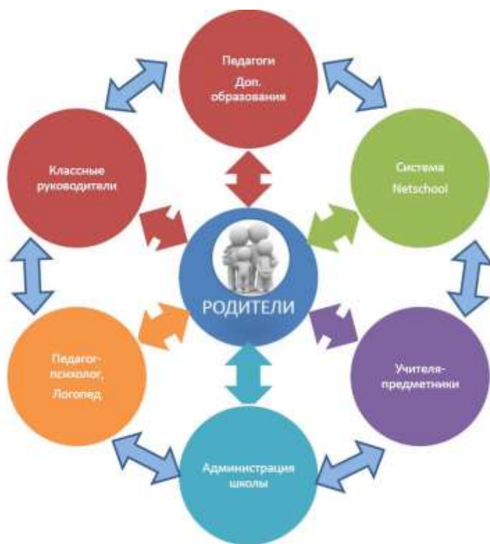
Рис. 1. Схема взаимодействия с родителями для формирования ответственной и позитивной родительской позиции

В школе сложилась определённая система взаимодействия с родителями. Она представлена в виде схемы. Родители имеют информацию об образовательном процессе, событиях, которые происходят в школе. Через систему Netschool (приложение 2), они могут задать вопросы классному руководителю, учителям-предметникам, администрации и получить ответы. Родители имеют возможность включаться в школьную жизнь, так как в систему «выкладывается» практически вся информация о событиях, происходящих в образовательном учреждении.