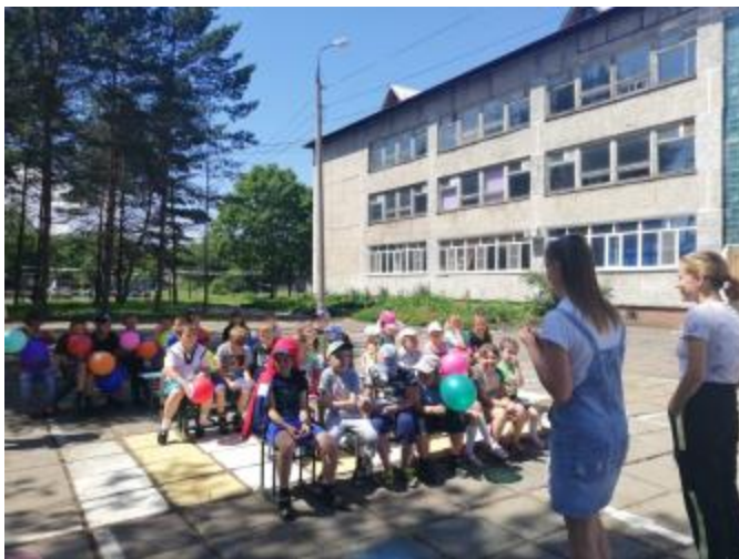
Занятия по финансовой грамотности