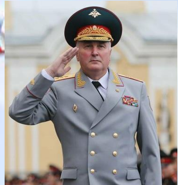
Начальник Главного военно-политического управления вооружённых сил генерал А. В. Картаполов

«Пентагон приступил к разработке принципиально новой стратегии ведения военных действий, которую уже окрестили «Троянский конь». Суть ее заключается в активном использовании протестного потенциала пятой колонны в интересах дестабилизации обстановки