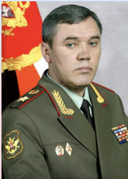
Начальник Генштаба В. В. Герасимов

За 25 лет мы смогли снабдить армию новейшим оружием, но уронили одно из самых мощных средств – ее духовную составляющую