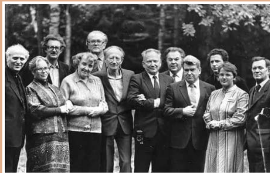
Педагоги-новаторы 80-90-х годов

Оформление идей гуманистической педагогики Ш. А. Амонашвили (своеобразный проект безотметочного обучения, обучения с шести лет), идей развивающего обучения по системе