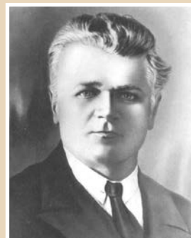
С. Т. Шацкий

Даже из этого небольшого исторического экскурса мы видим, что путь проектных идей к широкому распространению широк и нелегок: от отрицания и запретов до популяризации, от забвения до возрождения и модификации.