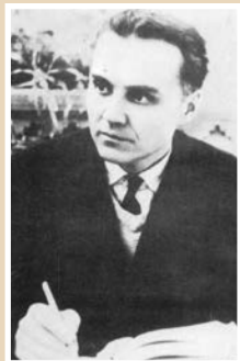
В. А. Сухомлинский

Именно он открыл альтернативную для того времени по духу и взаимоотношениям Павлышскую школу, которая подарила миру множество инновационных идей, отразившихся в дальнейшем на развитии системы образования: организация сельской школы, семейное воспитание, развитие детского творчества, организация работы с коллективом учителей, создание образовательной среды. Оказавшись не принятым высокими чиновниками, В. А. Сухомлинский не изменил ни одной своей идеи, став для нас одним из основоположников гуманистической педагогической культуры и примером создания опережающей время идеи сельской школы.