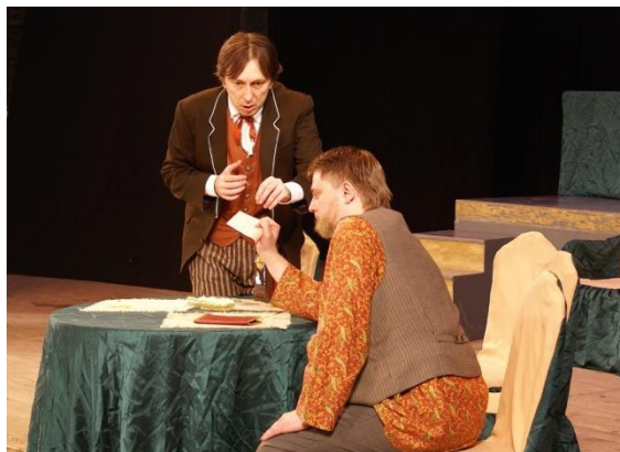
Кейс «Кредиты и кредиторы»