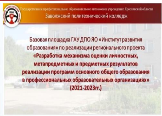
Приказ об утверждении проекта