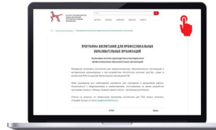
Отраслевая специфика подготовки кадров: ПРПВ и ПКПВ по УГПС + макет ПРПВ и ПКПВ

5. Уведомление обучающихся о введении новой программы