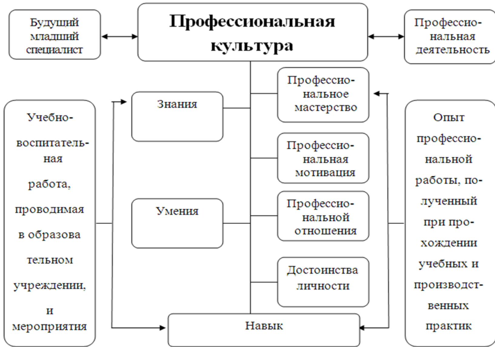
Модель профессиональной культуры будущего младшего специалиста профессионального образования.