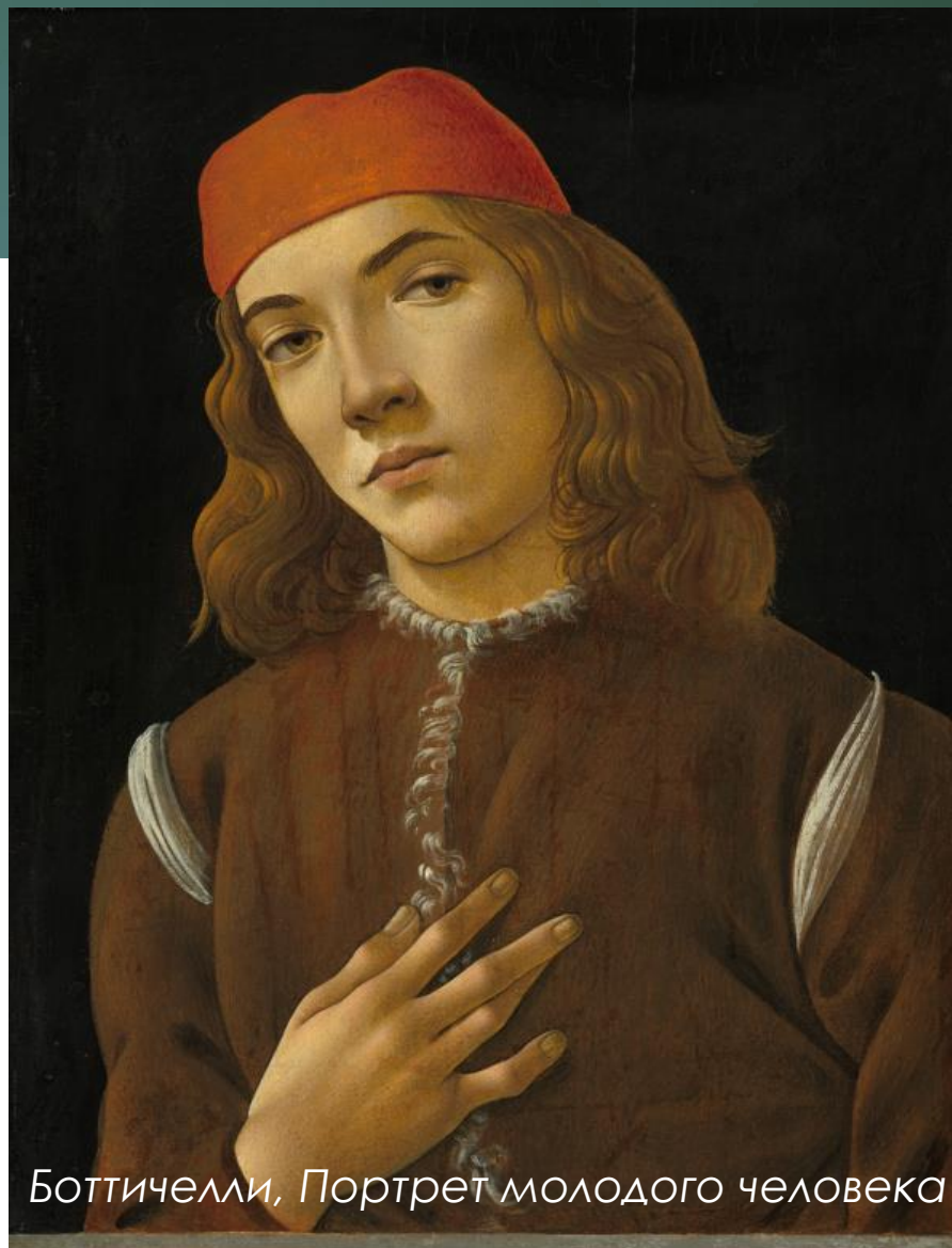
Боттичелли, Портрет молодого человека