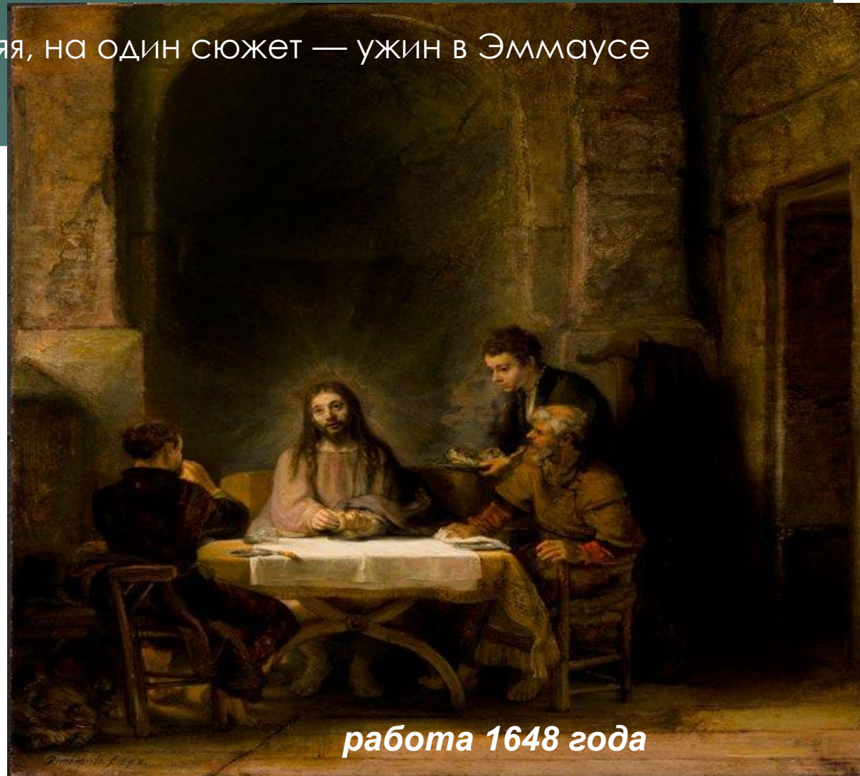
работа 1648 года