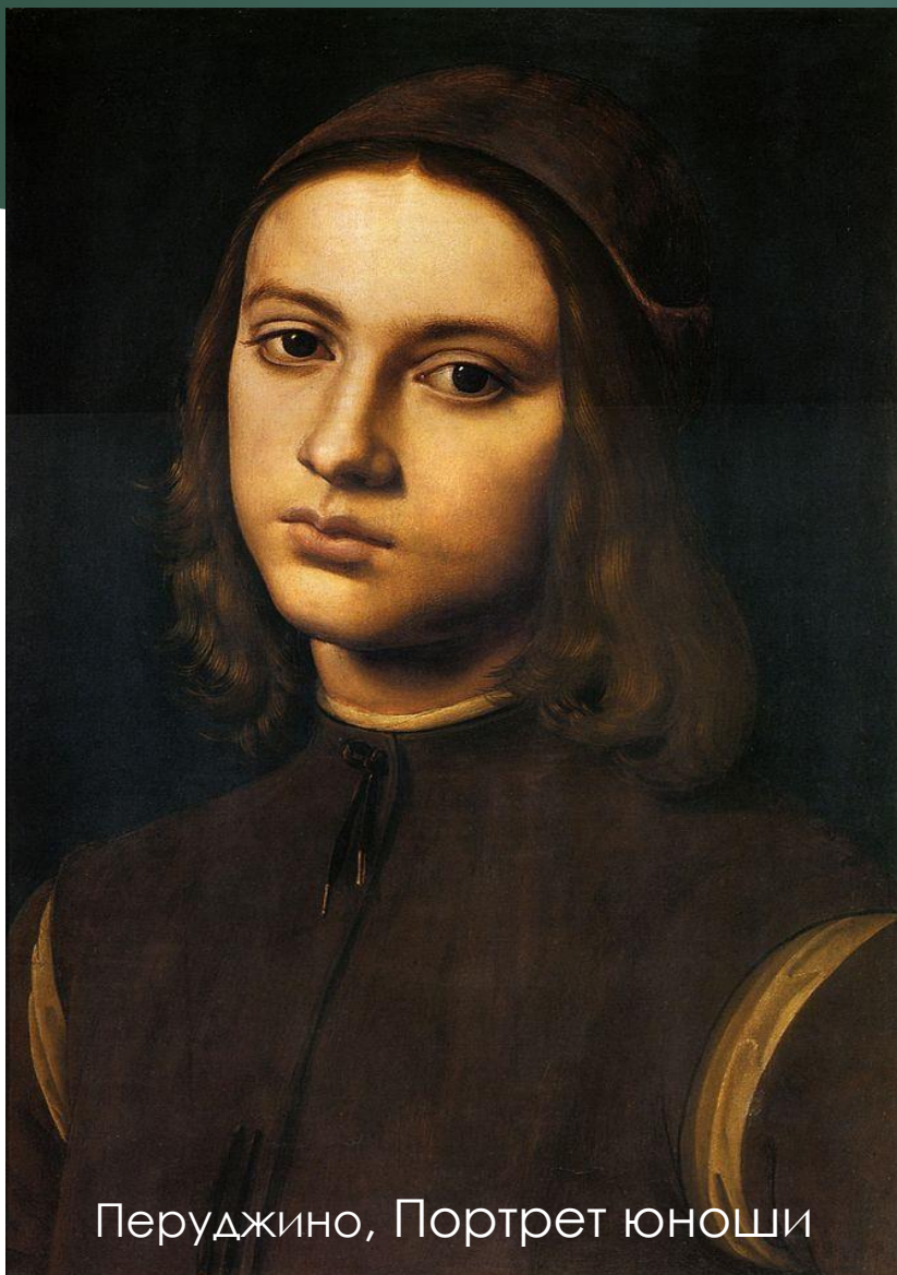
Перуджино, Портрет юноши