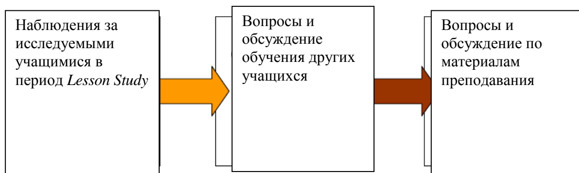
Рис. 3. Схема обсуждения после Lesson Study

Нижеследующий образец может быть использован для записи обсуждения по итогам урока