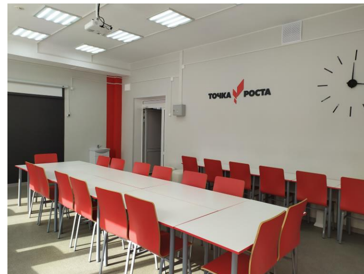
Фото внутренних вывесок и указателей (включая кобрендинг с логотипом национального проекта «Образование»)

Кабинет(ы) Центра с установленным оборудованием (на фото должны просматриваться: учебное оборудование, элементы декора и логотип «Точка Роста»)