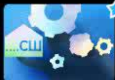
Дифференциация звуков [С], [Ш] в конц...