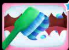
Чистим зубки спереди