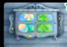
Загляни в окошко