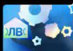
Дифференциация звуков [Л], [В] в слова...