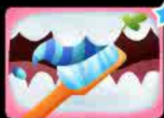
Чистим зубки сзади