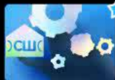
Дифференциация звуков [С], [Ш] в слов...