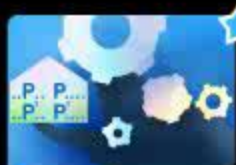
Дифференциация звуков [Р], [Рь] в нача...