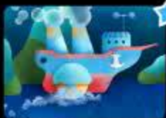
Путешествие на пароходе