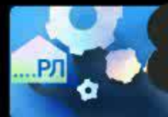
Дифференциация звуков [Р], [Л] в конце...