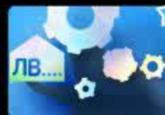
Дифференциация звуков [Л], [В] в начал...