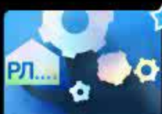
Дифференциация звуков [Р], [Л] в начал...