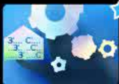
Дифференциация звуков [Съ] [Зъ] в нач...