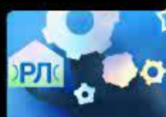
Дифференциация звуков [Р] и [Л] в слов...