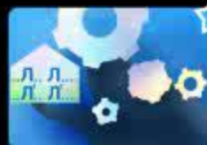
Дифференциация звуков [Л], [Ль] в нач...