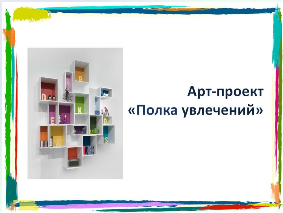
Арт-проект «Полка увлечений»